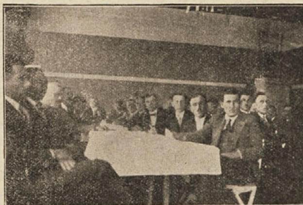
Делгата на Конгресу слушају извештај секретара.