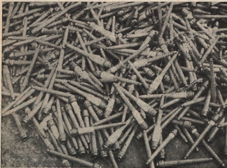
Tudi takih stroškov si ne bi smeli privoščiti, pa jih še vedno dopuščamo

Tudi vpliv visokih zalog na pomanjkanje obratnih sredstev se odraža kot posledica prav takšnega pomanjkanja obratnih sredstev tako pri naših kupcih kot pri naših dobaviteljih. Problem visokih zalog surovin in materiala je podedovan iz časov, ko je zaradi pomanjkanja materiala morala industrija nabavljati material na zalogo takrat, ko ga je dobila, da bi pomanjkanje ne vplivalo na normalni potek proizvodnje. Danes se te zaloge morale formirati v trgovini, da bi industrija ob pomanjkanju obratnih sredstev nabavljala material takrat, ko ga potrebuje in v manjših količinah. S sredstvi, ki bi se na ta način sprostil pa bi lahko svoje izdelke prodajali pod ugodnejšimi plačilnimi pogoji. Trgovina danes zaradi pomanjkanja obratnih sredstev ni sposobna sprejeti teh zalog, niti ne formirati potrebnih zalog materiala za bodoče poslovanje, medtem ko so v naših skladiščih prevelike zaloge, ki jih morda drugje industrija potrebuje, ali pa so te zaloge že celo nekurantne.