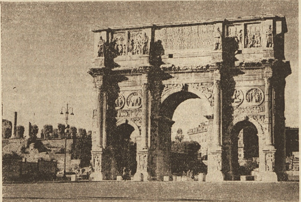
Slavolok Konstantins Velikega iz dobe rimskega cesarstva

Stari problemi obstajajo še dalje, toda vlada jih sedaj rešuje s pravo avtoriteto in širokogrudnostjo. Ze ves čas, odkar so se zavezniki izkrcali na njenih obalah, se je Italija borila za svojo obnovo in stalnost v senci besede »začasno.« Ničesar ni bilo trajnega.