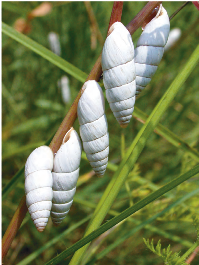
Poletni počitek oziroma estivacija polžev (verjetno iz rodu Medora) v romunskem narodnem parku Padurea Hagieni.