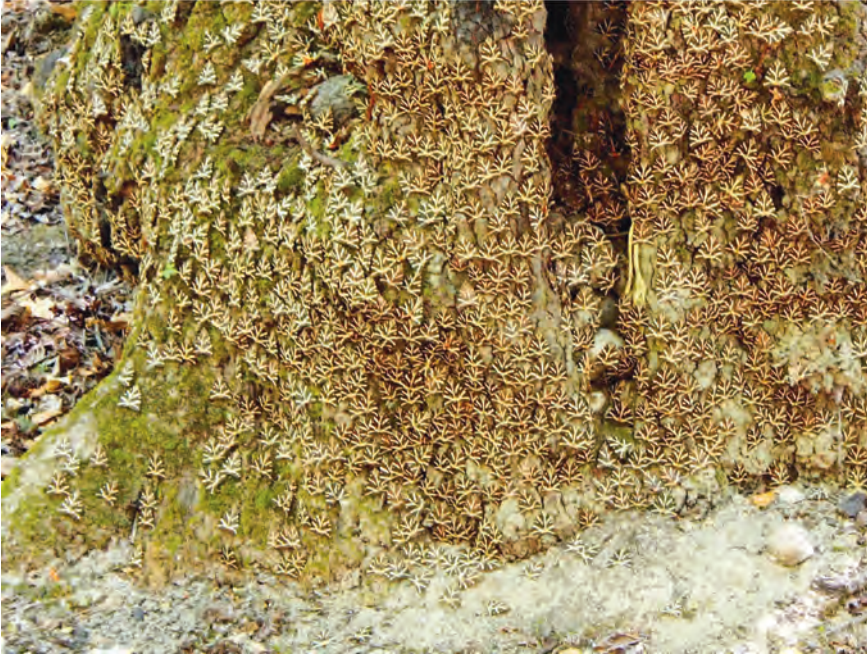
Množica metuljev na deblu večjega drevesa.