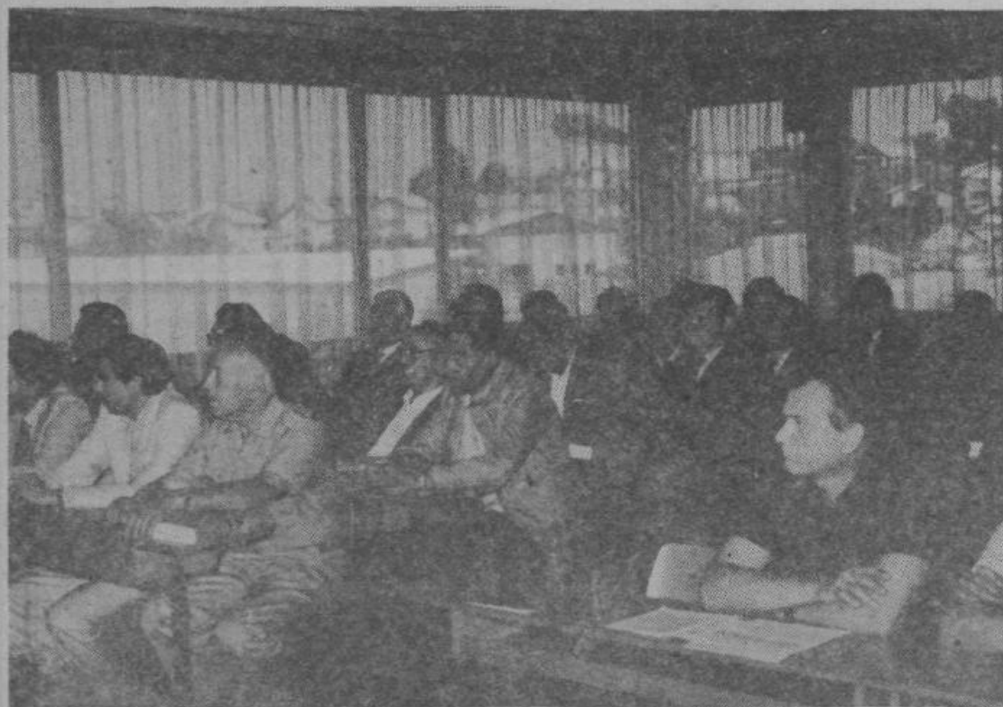
S slavnostne seje OO ZB NOV Grosuplje ob Dnevu borca.