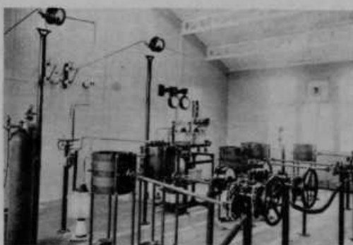
Oddajni stroji v radiopostaji v Domžalah.

Država je zgradila v Domžalah veliko radiooddajno postajo. Vse je plačala Nemčija na račun vojne odškodnine. Ta postaja se bo slišala po vsej Evropi. V Sloveniji pa še posebno natančno in močno. V najem jo je vzela naša Prosветna zveza za 15 let. Otvorila se bo postaja jeseni. Slišali bomo lahko vsak dan razno godbo, petje, koristna predavanja, govore, tudi cer-