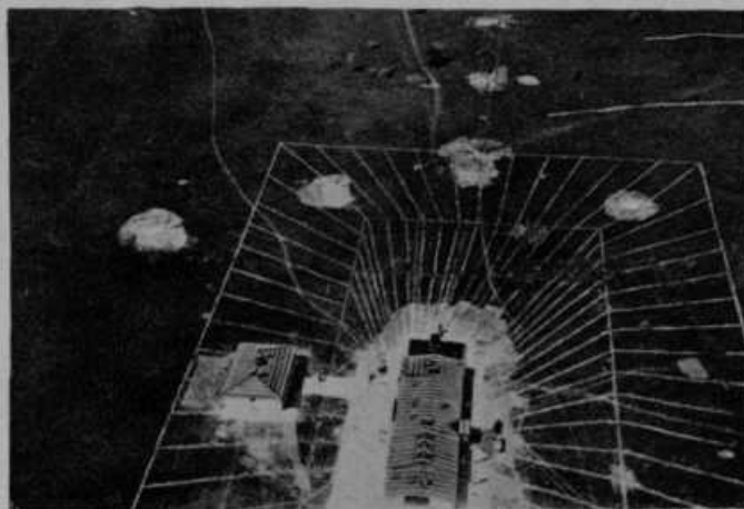
Pogled na radiopostajo z vrha antenskega stolpa.

kvene pridige, vremenska in gospodarska poročila, novice s celega sveta. Vršilo se bo to takole: V Ljubljani na dvorišču Gospodarske zveze je zgrajena posebna dvorana, ki se imenuje „studio“. V tej dvorani se bodo vršili koncerti, predavanja itd. Telefonska žica bo nesla vse to v Domžale, kjer bodo posebni stroji vse sprejete glasove spravili v anteno, ki bo povzročala radijske