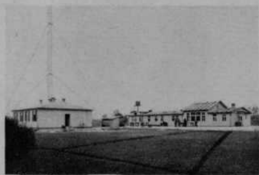
Zgradba radiopostaje v Domžalah.

Država je zgradila v Domžalah veliko radiooddajno postajo. Vse je plačala Nemčija na račun vojne odškodnine. Ta postaja se bo slišala po vsej Evropi. V Sloveniji pa še posebno natančno in močno. V najem jo je vzela naša Prosветna zveza za 15 let. Otvorila se bo postaja jeseni. Slišali bomo lahko vsak dan razno godbo, petje, koristna predavanja, govore, tudi cer-