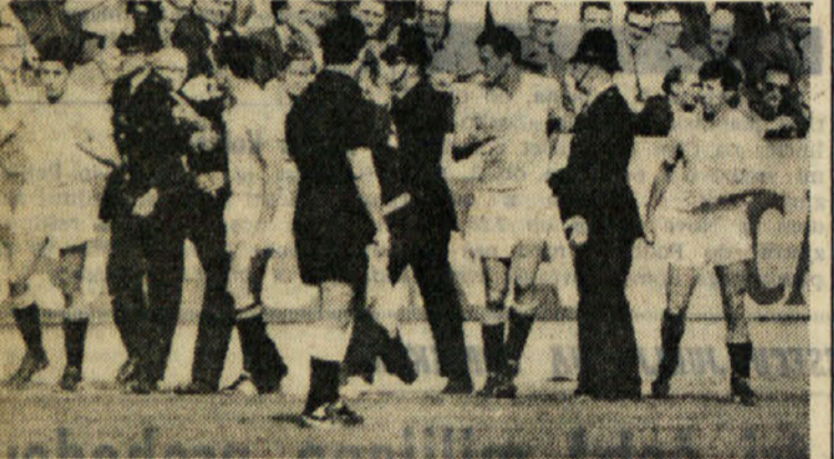
Ko so igrali Južnoameričani je morala sodniku pomagati tudi policija