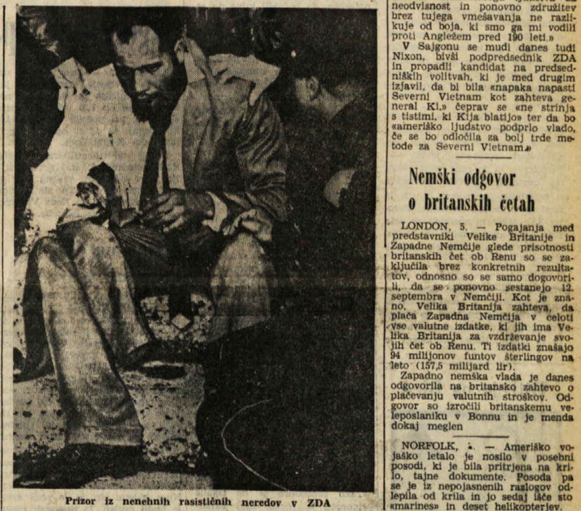
Prizor iz nenehnih rasističnih neredov v ZDA

LONDON, 5. — Vso noč, do danes zjutraj, je poslanska komisija petindvajsetih končala z razpravo o zakonu za blokado cen in plač. Razpravljanje je bilo precej nenavadno, ker so poslanci imeli na razpolago osem zložljivih postelj na hodniku. Bilo pa je tudi precej napeto, ker je prišlo do prepira, tako da je danes zjutraj v znak protesta odšel iz dvorane bivši minister za tehnologijo in sedanjini generalni tajnik sindikata za prevoznike Frank Cousins. Dejal je, da močna deflacija in povečanje brezposelnosti nista edina alternativa za blokiranje mezd in plač.