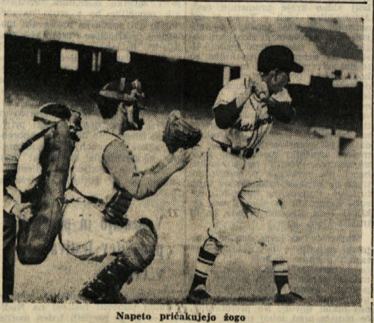
Napeto pričakujejo žogo