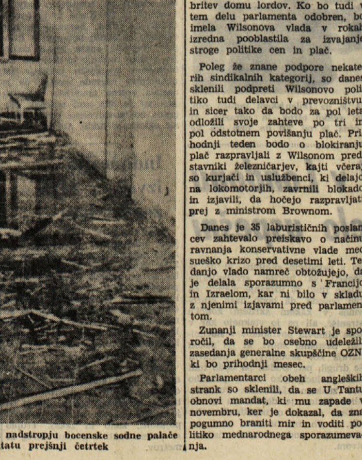
Tako je bil videti hodnik v drugem nadstropju bocenske sodne palače po terorističnem atentatu prejšnji četrtek