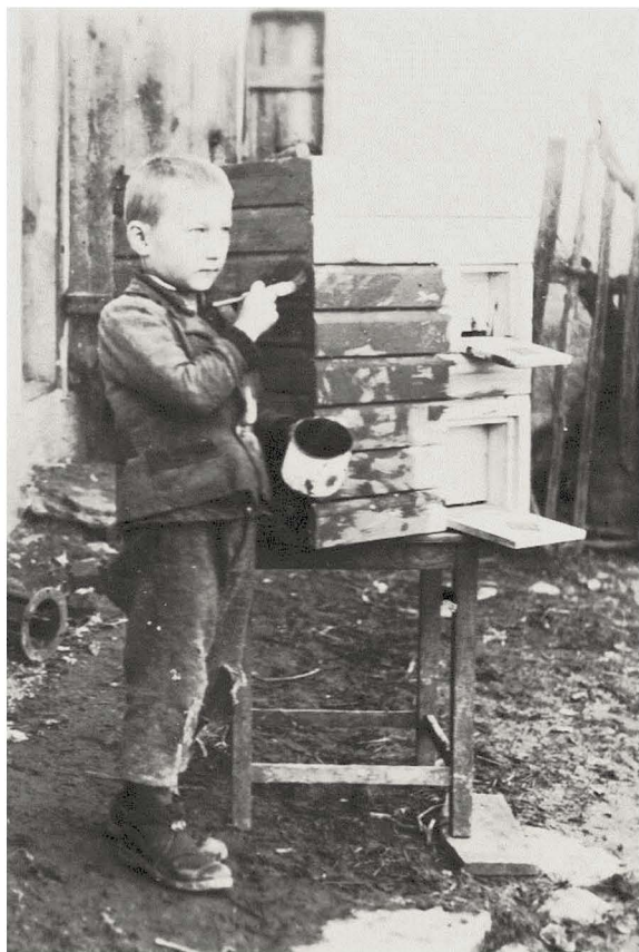
Moje delo pri izdelavi čebeljih panjev. 4

Predvojni čebelnjak so mu med vojno vihro Bolgari požgali. To je težko prebolel in po obnovi požgane domačije si je postavil tudi nov čebelnjak. V povojnem čebelnjaku je konec petdesetih let prejšnjega stoletja dosegel svoj čebelji rekord – 53 čebeljih družin – in temu primerno pridelavo medu.