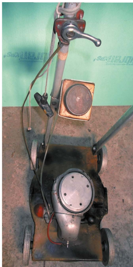
[Prva izdelana vrtna kosilnica v Jugoslaviji. 18