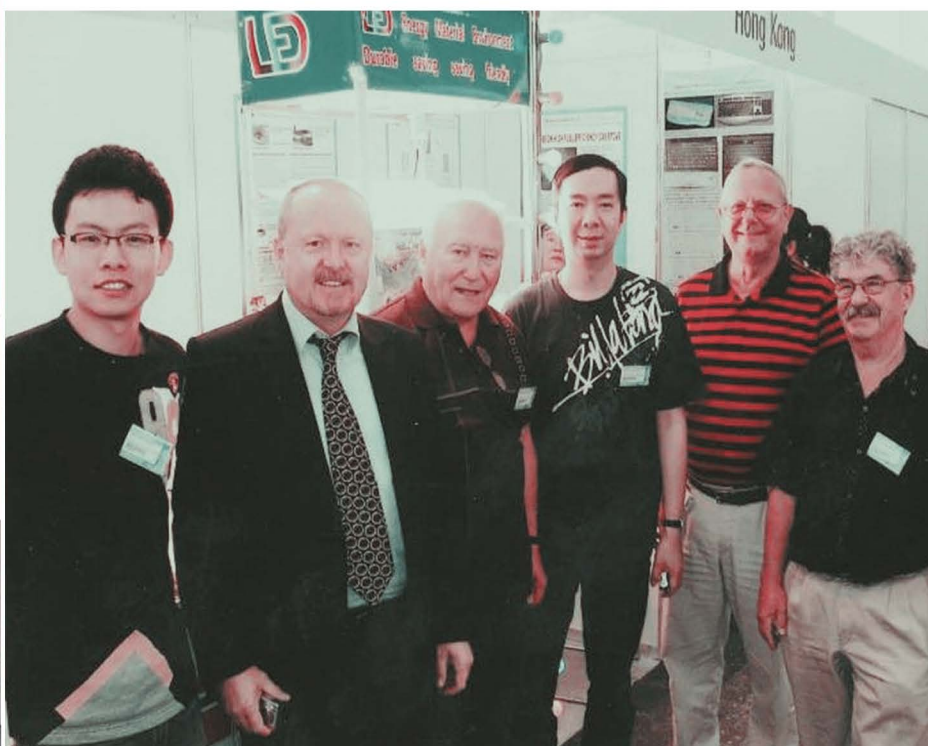
[Na mednarodnem sejmu izumiteljev »Genius Evropa 2009« v Budimpešti. 19