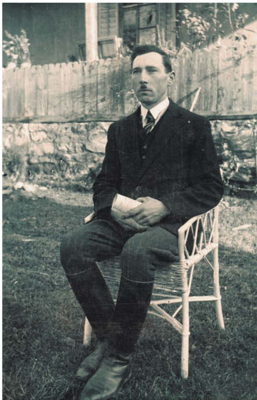
Fotoportret očeta na pravkar izdelanem stolu l. 1939. 3