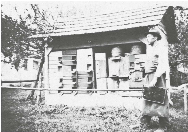
Atekov predvojni čebelnjak. 5

Predvojni čebelnjak so mu med vojno vihro Bolgari požgali. To je težko prebolel in po obnovi požgane domačije si je postavil tudi nov čebelnjak. V povojnem čebelnjaku je konec petdesetih let prejšnjega stoletja dosegel svoj čebelji rekord – 53 čebeljih družin – in temu primerno pridelavo medu.