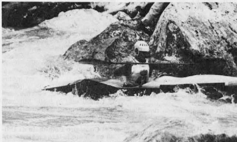
Un concorrente durante la prova singola

Le nazionali jugoslava e italiana, insieme a tedeschi e francesi, sono state le migliori ai campionati mondiali di discesa per canoa e kayak che si sono svolti sabato e domenica a Bovec (Plezzo) nell'Alta Valle dell'Isonzo.