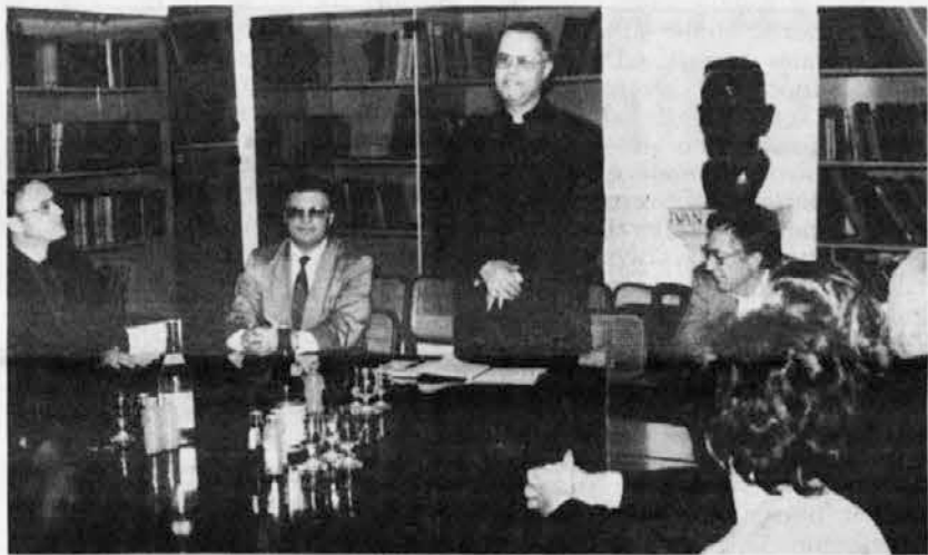
Na srečanju s koprskim škofom Pirihom v Čedadu

Le diverse problematiche sono state successivamente approfondite sia in un incontro di msgr. Pirih con i sacerdoti e gli altri membri della redazione del Dom, sia nel corso del pranzo dove è stata accolta da entrambe le parti la proposta di proseguire sulla strada della collaborazione intrapresa con incontri a cadenza regolare.