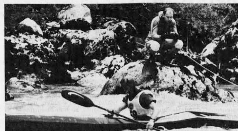
Potapljač »na preži« za vsak slučaj...