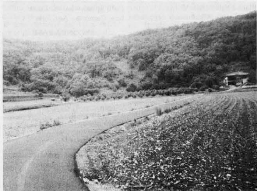
Klenje v špietarskem kamunu je luštna an čedna vas, kot smo vam vičkrat napisal. Pomislita, de seda za de bo še buj namest so jim celuo ašfialtal pot, ki miez senožen an njiv peje na Klančič

Ob nediejah in praznikah so odparte samuo zjutra, za ostali čas in za ponoč se more klicat samuo, če riceta ima napisano »urgente«.