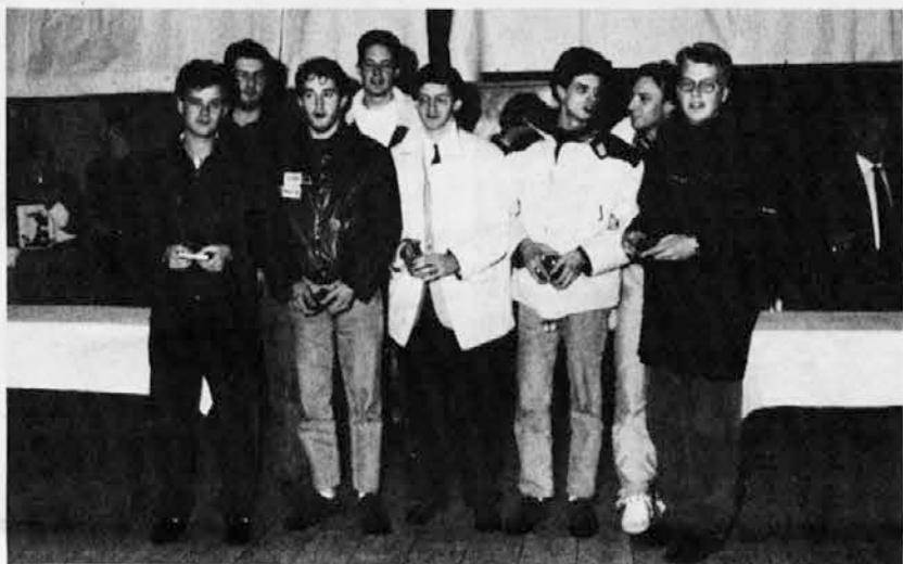
La squadra maschile della Polisportiva S. Leonardo

Nel corso della riunione è stata messa in evidenza la doppia promozione ottenuta dalle squadre femminile e maschile. Questi ultimi hanno rinunciato al campionato di 1. divisione. È stata ventilata l'ipotesi di costituire anche una formazione giovanile maschile.