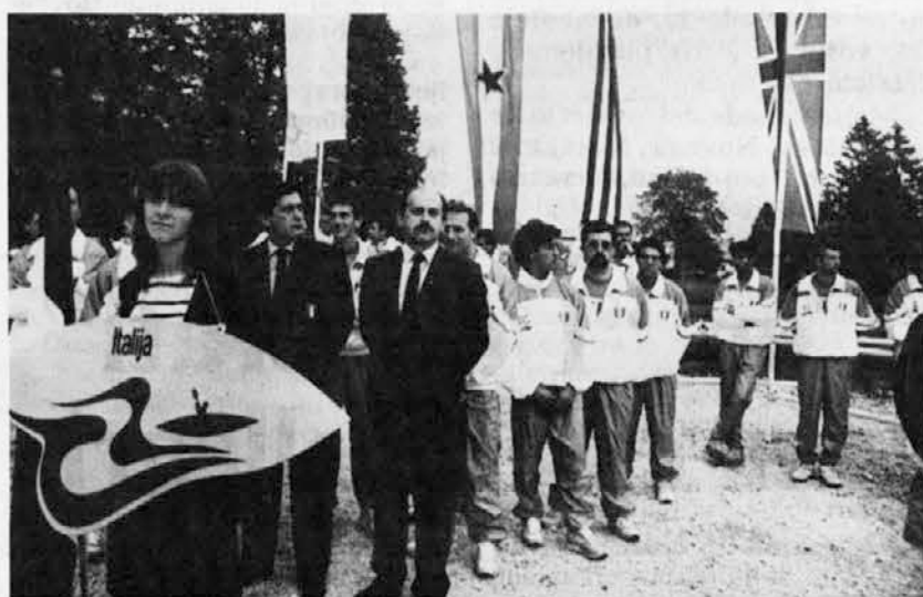
Italijanska reprezentanca med otvoritvijo