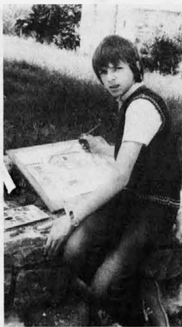
Arhivski posnetek o našem ex-tempore. Pred leti so se je udeleževali tudi zelo mladi ustvarjalci

Iniziativa internazionale con il patrocinio della Giunta del FVG