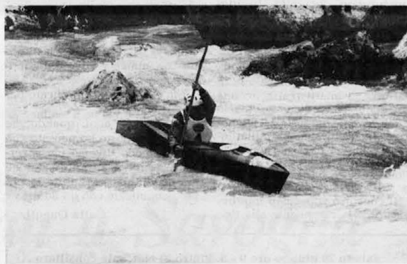
Premagovati brzice ni bila lahka stvar