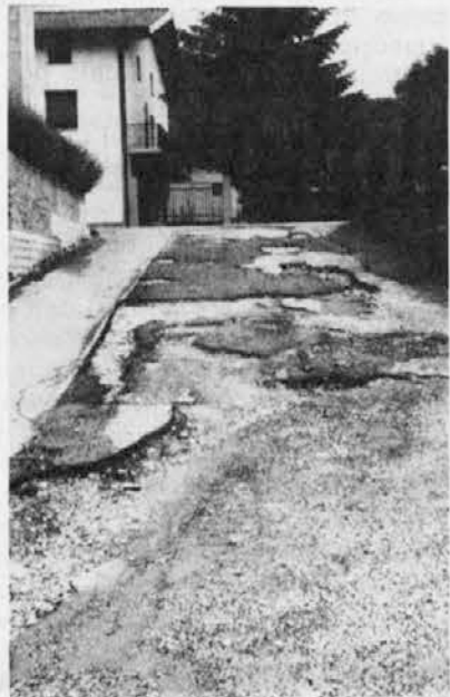
Paš al jim je ostalo kiek šfalta? Tle smo le v Špietre, kjer je "Centro". Vsak dan se po teli uoze puno judi, tistih ki hodejo v dvojezično šuolo an tistih, ki imajo hiše v velikem armenim hramu

Lahko jih deneta tu škatle an neseta du Čedad, kjer v hramu v ul. Udine, na štev. 58. Caritas iz Čedada pobiera an zbiera vse tuole blaguo za nest, konca telega miesca, dol v Albanijo potriebnim ljudem.