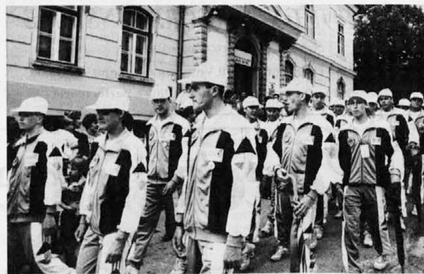
»Plava« reprezentanca med mimohodom v Bovcu