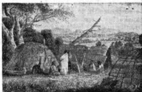
Vigvami indijanskega plemena Vinebago