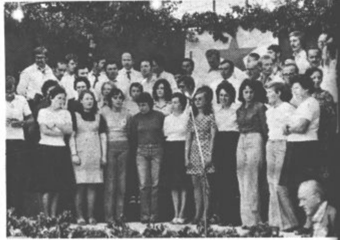
V počastitev 30-letnice osvoboditve je nekaj pesmi zapel mešani pevski zbor iz Šostanja.