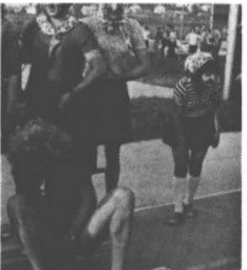
Zdravniški pregled je bil natančen. Tale ženska ali moški je moral(a) pred tekmo izprazniti črevesje.

Na klop za rezervo so poslali predstavnice pravega ženskega spola. Da se ne bi zmotili pri naši trditvi, smo raje napravili posnetek.