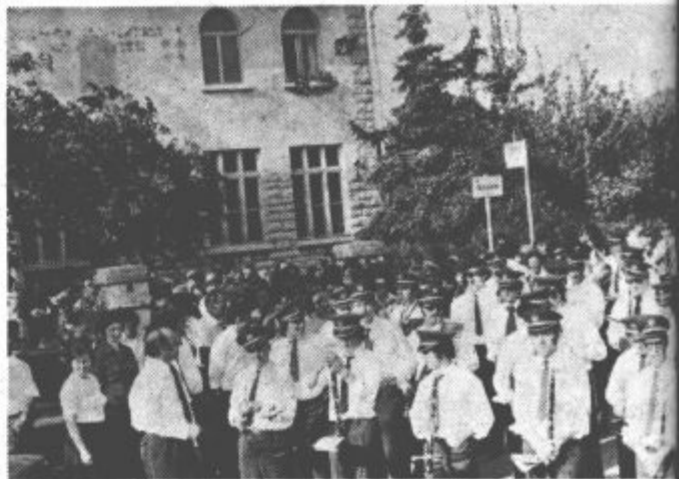
Na sredi med Grupado in Padričami je osnovna šola, ki se imenuje po partizanskem pesniku Kajuhu.