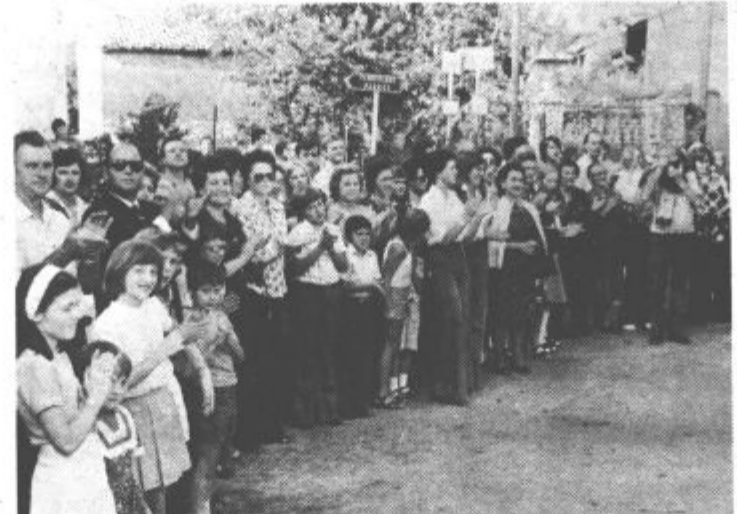
V Grupadi so nas nadvse pristrčno sprejeli številni domačini.

Pozno zvečer se je bilo treba posloviti. Domačini so se z hvaležnostjo zahvaljevali imenu Svobode, ki so obogatili njihov program ob 30-letni osvoboditve, mi pa nismo mogli besed zahvale za prijetno bivanje, ki so nam pripravili vaščani Grupade Padrič. In ob koncu je bila izrečena obljuba, da se bo sodelovanje med Slovenci na dveh straneh meje in Šostanjčanom prihodnje še poglobilo.