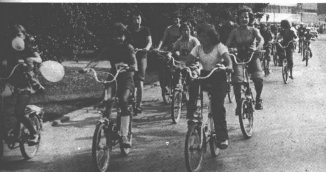
To nedeljo je društvo humoristov iz Velenja pripravilo kolesarsko vožnjo na 7 kilometrov dolgi progi od Velenja preko Sentilja. Na pot je odšlo več sto kolesarjev. Na cilju pa so odigrali rokometno tekmo med ženskami in moškimi. Seveda so zmagale predstavnice nežnejšega spola. Več o velenjskem „bicikel rallyju“ poročamo na notranjih straneh.

Med priložnostnim kulturnim programom, v katerem bosta sodelovala tudi moški pevski zbor Svobode Mislinja in Delavska godba Slovenj Gradec, bodo predstavili utrinke s prostovoljnih delovnih akcij.