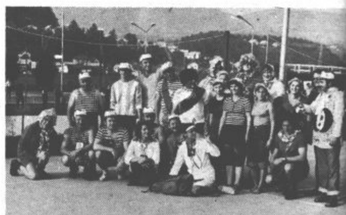
Pred začetkom roketne tekme sta se obe ekipi skupaj z zdravnico in bolničarko ter seveda vodjem tekmovanja zbrali pred našim objektivom in pozirali.