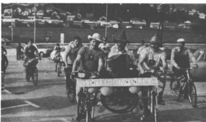
Kolesarji iz Vinske gore so kolesarjenje vzeli za šalo. Vendar ni bilo tako. Na cilju so takoj poiskali okrepčilo.