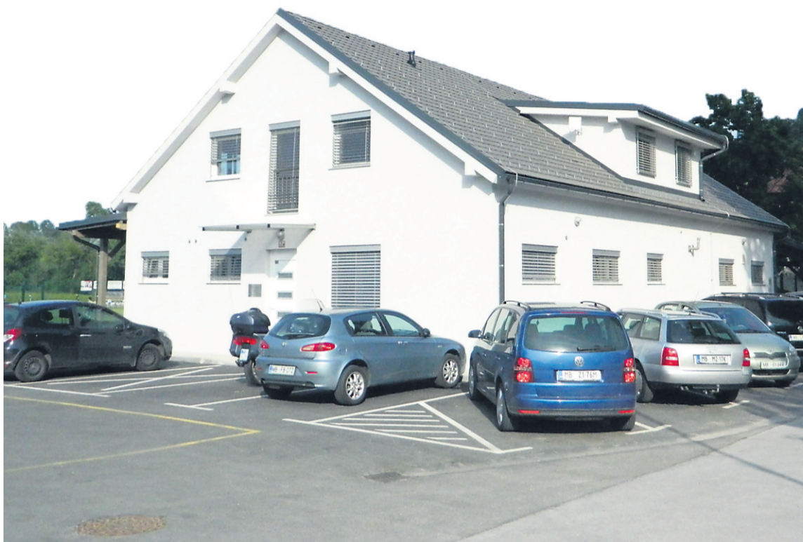
Videmski športni objekt še ni prav zaživel, pa mu bodo (začasno) že spreminjali namembnost: v mansardi bosta dva oddelka vrta.

soč evrov? Župan je svetnike, ki so na prejšnji seji morali kot kakšni berači v rebalansu brskati za vsakim evrom na najrazličnejših postavkah, se odpovedati metrom asfalta tu, da so lahko uskladili prihodke in izdatke, potolažil, da dobro kaže pri prodaji parcel v obrtni coni in da je prepričan, da jim bo uspelo zbrati dovolj denarja za vrtec. Še več ga bo: za pol milijona, ko bodo plačani še komunalni prispevki ob izdaji