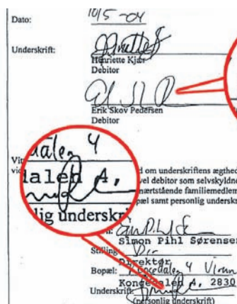
Fotografija je simbolična.