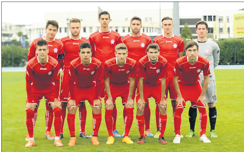
Začetna enajsterica Aluminija, ki se je v finalu mladinskega Pokala Slovenije v Kopru merila z Domžalčani.

Zanimivo je bilo tudi na obračunu med mladinci Aluminija in Domžal. Kidričani so na poti do finala izločili Celje (5:4, po 11-m), Farmtech Veržej (3:0) in Robert Koren Dravograd (5:1). Tako so naskakovali drugo lovoriko v tem tekmovanju, doslej edino so osvojili v sezoni 2005/06, ko so ugnali Goričane (leto pred tem so izgubili finale proti Kopru). V zadnjih dveh