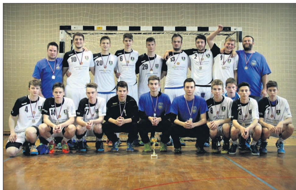
Kadeti Jeruzalema Ormoža so osvojili končno 2. mesto v državi.