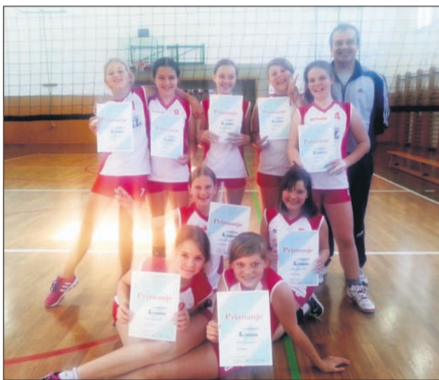
Zmagovalna ekipa območnega tekmovanja v odbojki za dekleta: OŠ dr. Jožeta Pučnika Črešnjevec