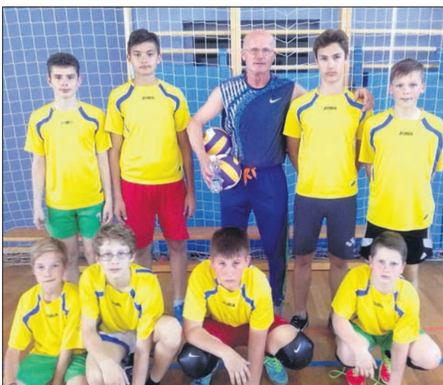
Ekipa OŠ Videm-Leskovec – zmagovalka območnega tekmovanja v odbojki.