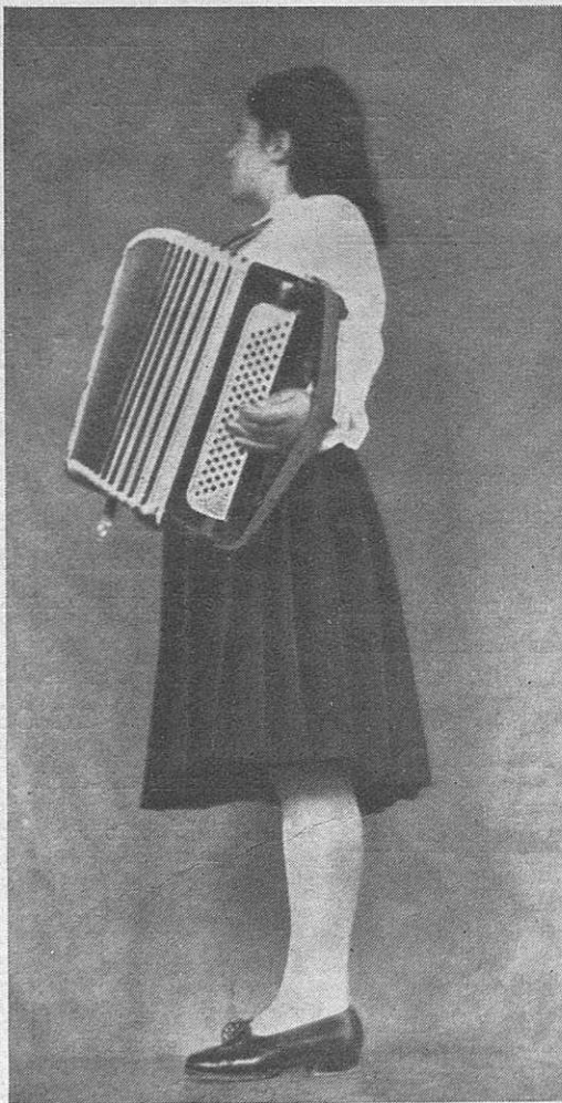
Attività della G. I. L. L. Delovanje G. I. L. L.-a

UMETNIŠKO IN GLASBENO DELOVANJE: Nadaljujejo se tečaji za zborovo petje gojencev srednjih, meščanskih in ljudskih šol, tečaj za zborovo petje dečkov, harmoniški tečaj za Balillo in Piccole Italiane in priprave male italijanske opere «Il gatto di Marcolfo», prevedene v slovenščino.