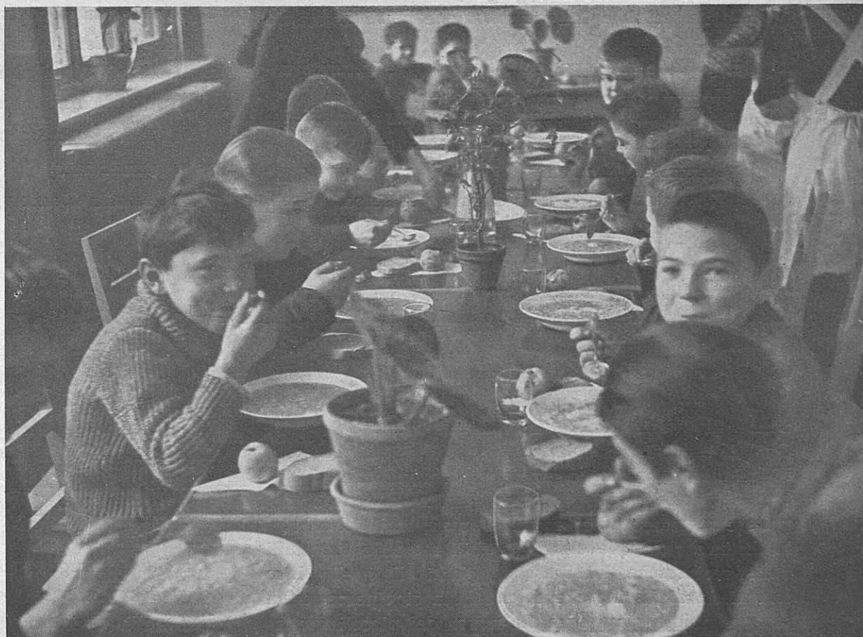
Dove si vede come non manca nè l'appetito nè il buon umore kjer ne manjka tek niti dobra volja