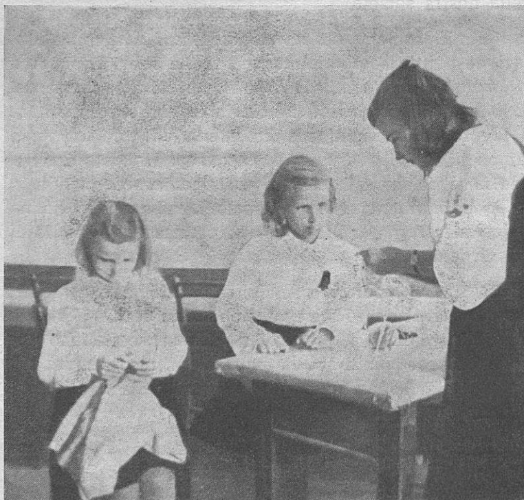
Corso di Economia domestica della G. I. L. L. — Nella sala di lavoro Gospodinjski tečaj G. I. L.-a — V delovni dvorani

Organizacije Fašizma, Nacional-Socializma in Španske Falange so znale ustvariti v ženi to posebno duševno