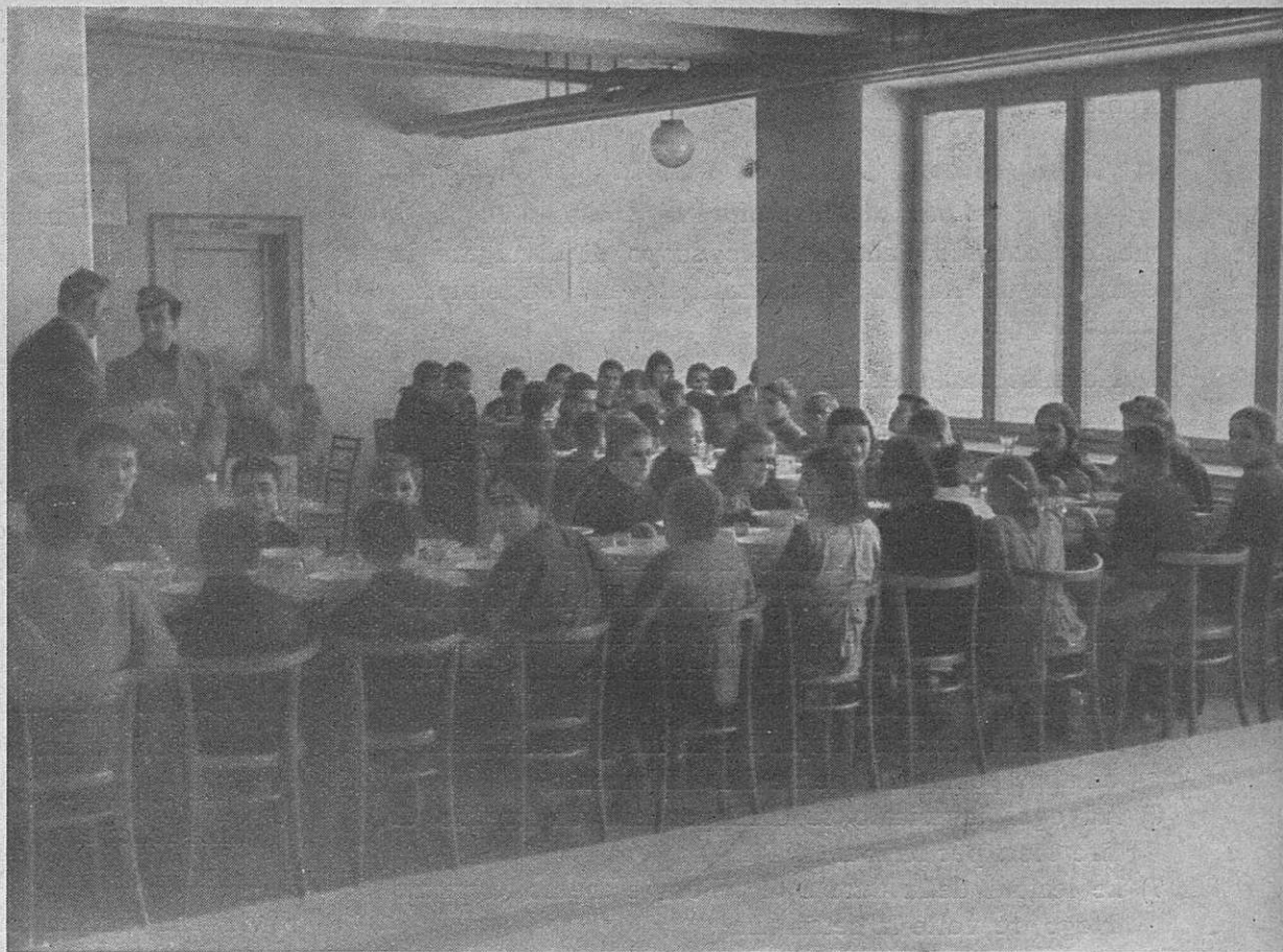
Una bella nidiata V prijetnem zaposljenju

Tajnik Stranke, kot vrhovni Poveljnik G. I. L.-a, je odredil z okrožno brzojavko vsem podrejenim Zveznim Poveljstvom Kraljestva, da naj se nadaljuje s šolskimi kuhinjami v vseh pokrajinah do konca šolskega leta. Po tem ukrepu bo uživalo v Ljubljanski pokrajini dobroto šolskih obedov še nadalje šest tisoč gojencev, ki so posebno potrebni pomoči.