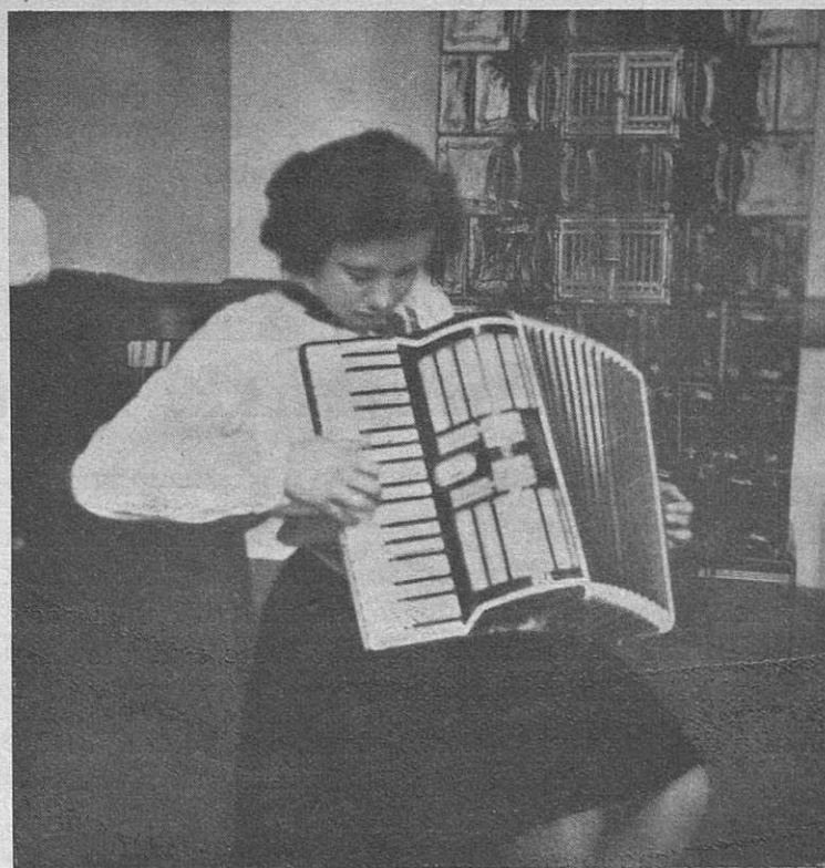
Attività della G.I.L.L. — Un allieva del Corso di fisarmonica acquisita dimestichezza con la tastiera Delovanje G.I.L.L.-a. — Gojenka harmoniškega tečaja se vadi spretnosti s tipkami

Tiha in nepretrgana gorečnost dela in pobud priča, kako je italijanska žena intenzivno zavzeta po zahtevah vojne. Znano je, da so nekatere Federacije ustanovile nemške tečaje za delavke, ki gredo v Nemčijo, druge so pa ustanovile «tečaje za obutev», koristno predelajoč rabljene predmete z namenom, da se dobi denar v korist otrokom padlih vojakov. V mnogih kmečkih središčih nudijo gospodinje prostovoljno svojo pomoč za žetev sena in drugih deželnih pridelkov. V Roveretu deluje «Vojaška šola». V Speziji se je vršil «Dan cigarete», na katerem so se Fašistične žene in Giovani Fasciste