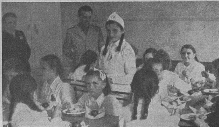
Corso di Economia domestica della G.I.L.L. — Al refettorio Gospodinjski tečaj G.I.L.L.-a. — Tečaj v obednici

Le organizzazioni suddette hanno aperto l'orizzonte ad una disciplina e ad un'etica nuova, che sono i chiari