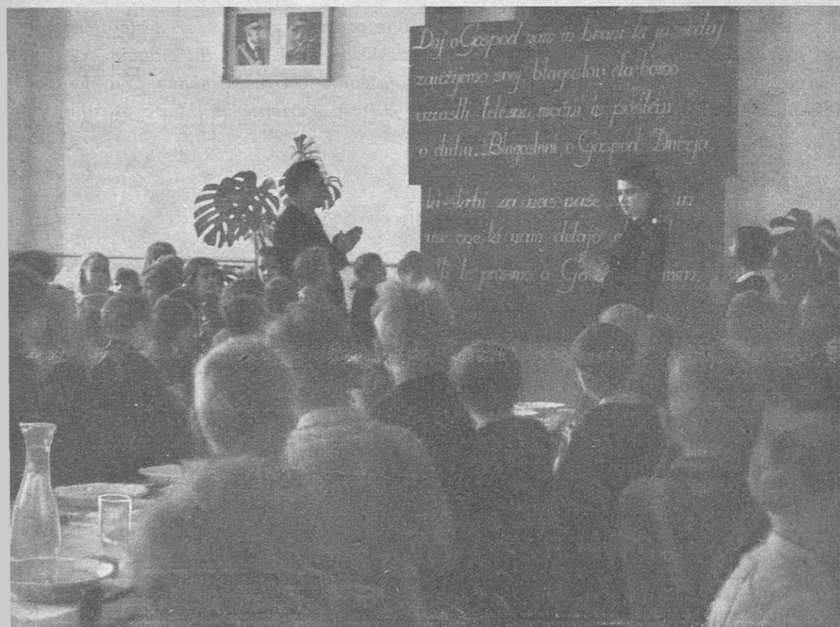
La preghiera che precede la refezione Molitev pred obedom

Il Segretario del Partito, nella sua qualità di Comandante Generale della G.I.L., con telegramma circolare ai dipendenti Comandi Federali del Regno, ha disposto che la refezione scolastica continui in tutte le provincie fino al termine dell'anno scolastico. Con tale provvedimento nella provincia di Lubiana seguiranno a godere del beneficio della refezione oltre seimila alunni particolarmente bisognosi di assistenza.