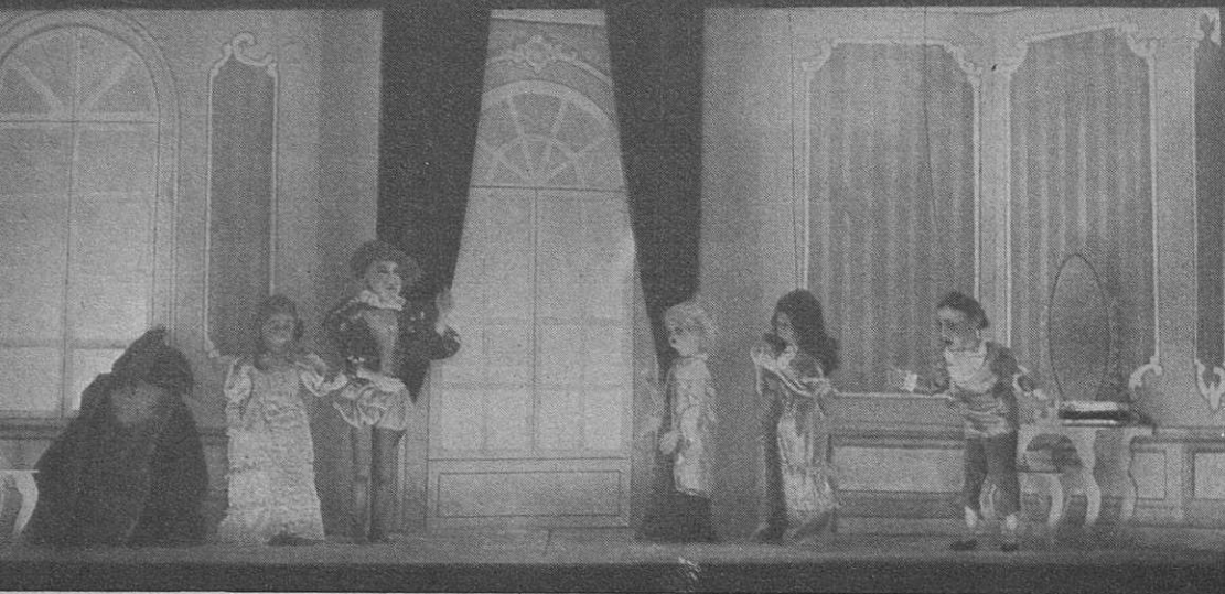
Gli spettacoli marionettistici dela G. I. L. L. — «La Regina di Fandonfrottole» (alla Sala Bianca dell'Union in Lubiana)