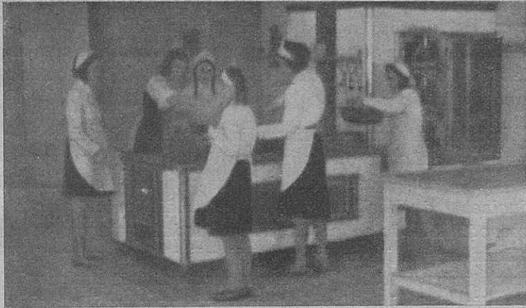
Corso di Economia domestica della G. I. L. L. — In cucina Gospodinjski tečaj G. I. L. L.-a. — Tečaj za kuhinjska opravila

questo nuovo orientamento, non si potrà mai prescindere da quella generica educazione, educazione che potremo riassumere in: amministrazione della casa, conoscenza dei vari lavori domestici, tecnica dell'assistenza igienica sociale, orientamento politico nel senso che l'opera educativa e formativa svolta dallo Stato non sia pregiudicata da una opposta educazione familiare.