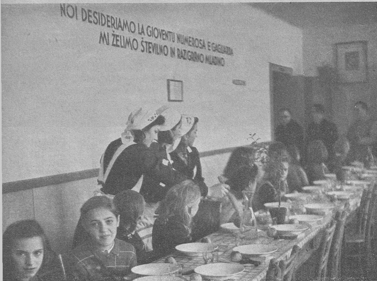
I commensali... vanno prendendo posto Udeleženci... zavzemajo prostor