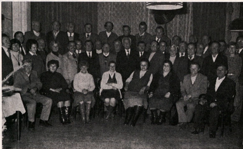
Kar precej je Ingradovih delavcev, ki so se lani upokojili. Takole so se zbrali skupaj...