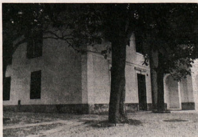
Naš počitniški dom v Portorožu (pri Bernardinu)