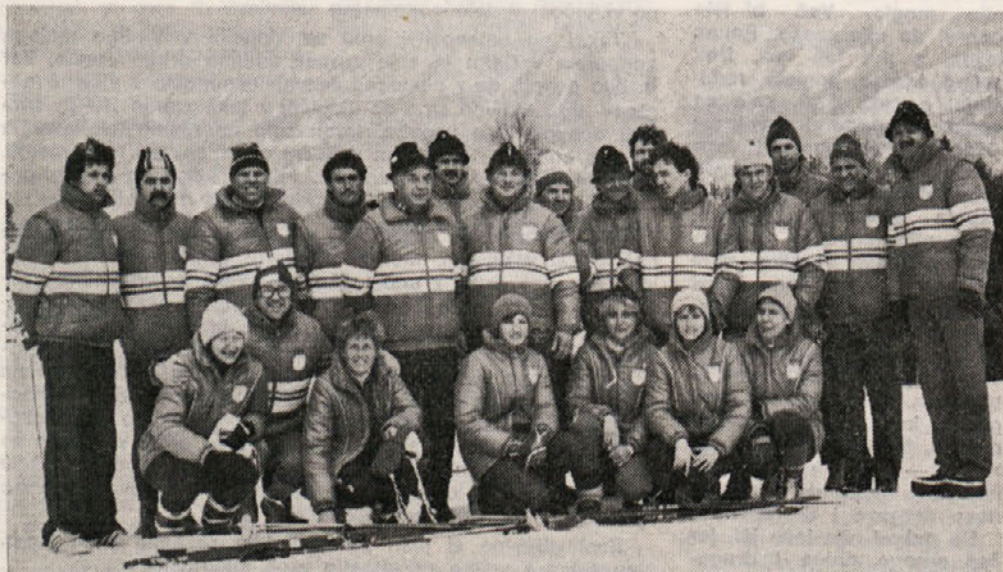
Smučarji Ingrada so se letos oblekli enotno (na svoje stroške, seveda). Niso le uspešni...

Po mnenju Izvršnega sveta SRS, sekretariata, je časnik oproščen davka na promet proizvodov (Št. 421-1/72, z dne 16. 7. 1974).