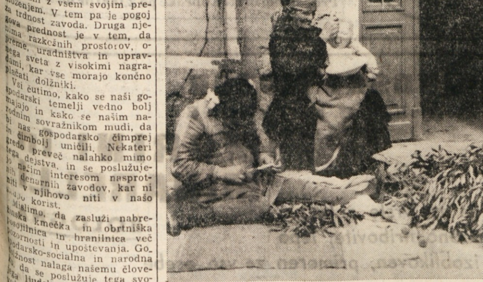
Zenice v tržaški okolici pripravljajo oljne vejice za danes

Lepo je rasel na visokem kraju proti morju moj hrast. Desetletja in desetletja sem zanj skrbel, se veseli njegove rasti, njegove kljubujoče borbe z burjo, njegove osvežitve, njegovega lista za steno moje kranice. Najlepše je bil med svojimi vrstniki tam v moji ogradi.