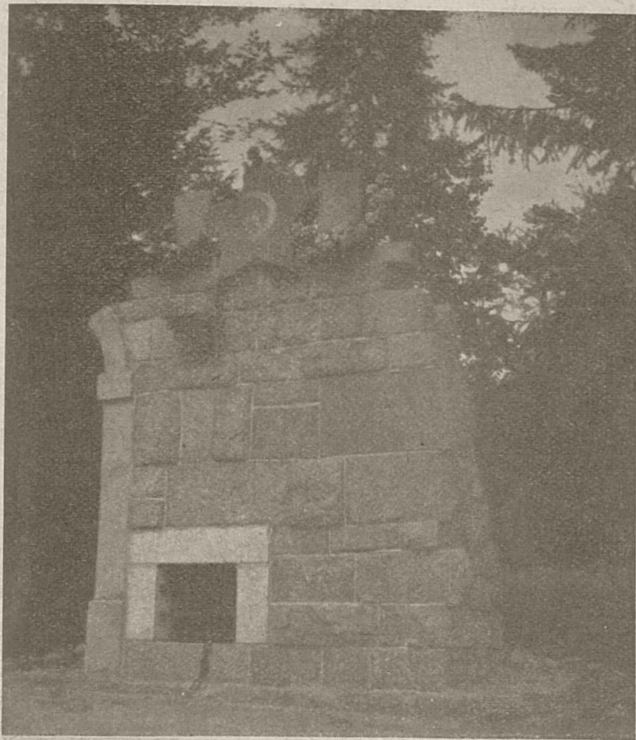
Spomenik padlim na Lanišćih pri Radljeju