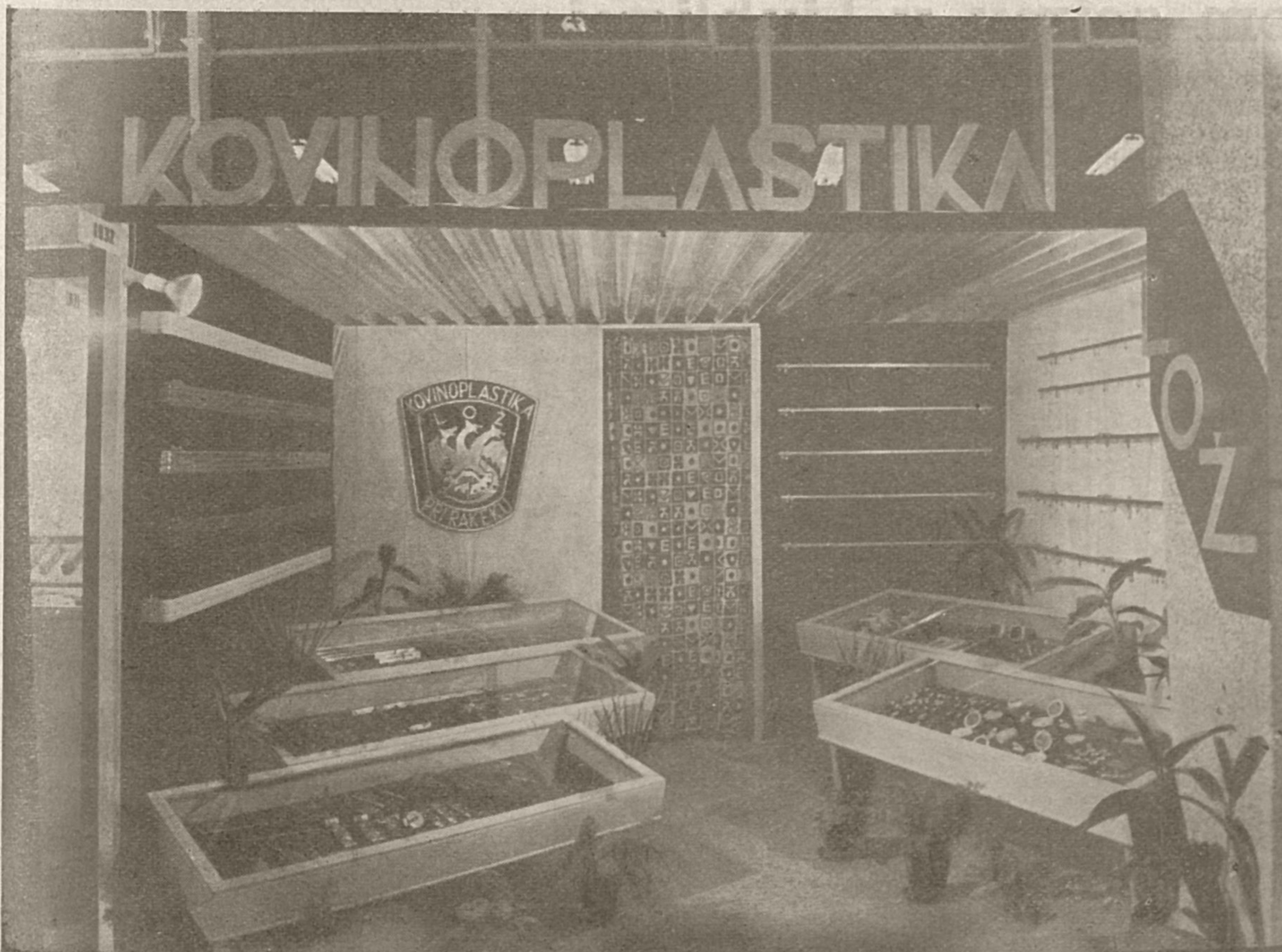
Paviljon Kovinoplastike Lož na mednarodnem sejmu tehnike v Beogradu