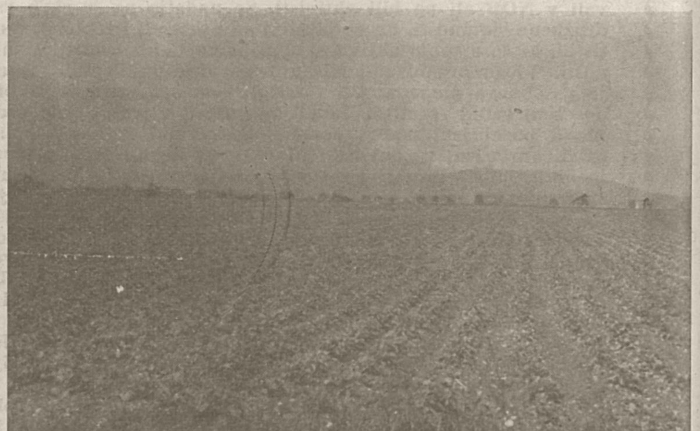
Letos so začeli na Marofu prvič saditi krompir na večjih kompleksih zemlje