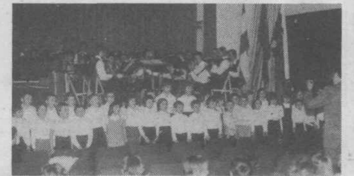
Med najuspešnejšimi točkami glasbenega večera je bila Vesela pionirska, ki so jo zares veselo zapeli učenci 3. pripravnice in 1. razreda nauka o glasbi glasbene šole ob spremeljavi Papirniškega pihalnega orkestra Vevče.

Poljski oddelek glasbene šole Moste-Polje in Papirniški pihalni orkester Vevče sta prvega junija zvečer priredila v Kulturnem domu na Vevčah nadvse prisrčen in lep glasbeni večer, na katerem sta prvič skupaj nastopila. Vsi nastopajoči so poslušalce, ki so do zadnjega kotička napolnili dvorano, navdušili s svojim peštrim in lepo pripravljenim programom. Krajanje Polja si želimo, da bi nam učenci glasbene šole in Papirniški pihalni orkester Vevče kaj kmalu spet omogočili tako prijetno urico glasbenega razvedrila. (Besedilo in foto: Dušan Jez)