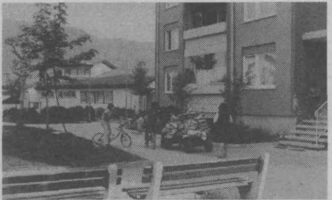
USPEŠNA AKCIJA — Učenci OŠ Adolfa Jakhla so organizirali obširno akcijo zbiranja odpadnega papirja. Zaključili so jo uspešno, dobljeni denar so si razdelili po razredih in ga porabili za končne izlete. Naše šrambe in okolico domov pa so rešili marsikatero navlake. MARJAN SREBRNJAK