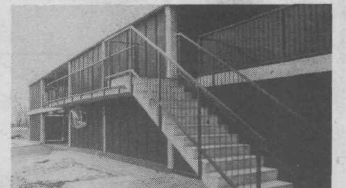
Tale garaža v Štepanjskem naselju je zgrajena že več mesecev, pa še vedno sameva brez uporabnikov, kajti po najnovejši informaciji še ni izdano uporabno dovoljenje zaradi neurejene okolice. (op. Okolico že urejajo.) Lepo urejena garaža ima tudi telefonsko celico, kar je velika pridobitev za krajanse, saj je javna govorilnica le pri trgovini NAMA. (Hvastija)