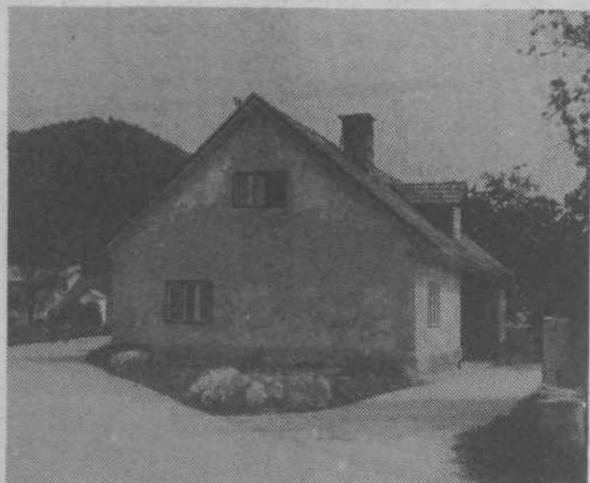
Gostilna PRI ZIMOVCU v Sp. Kašlju, kjer je bilo avgusta leta 1927 ustanovljeno društvo SVOBODA