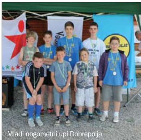
Mladi nogometni upi Dobrepolja