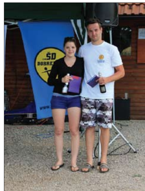
Miss in mister mivke