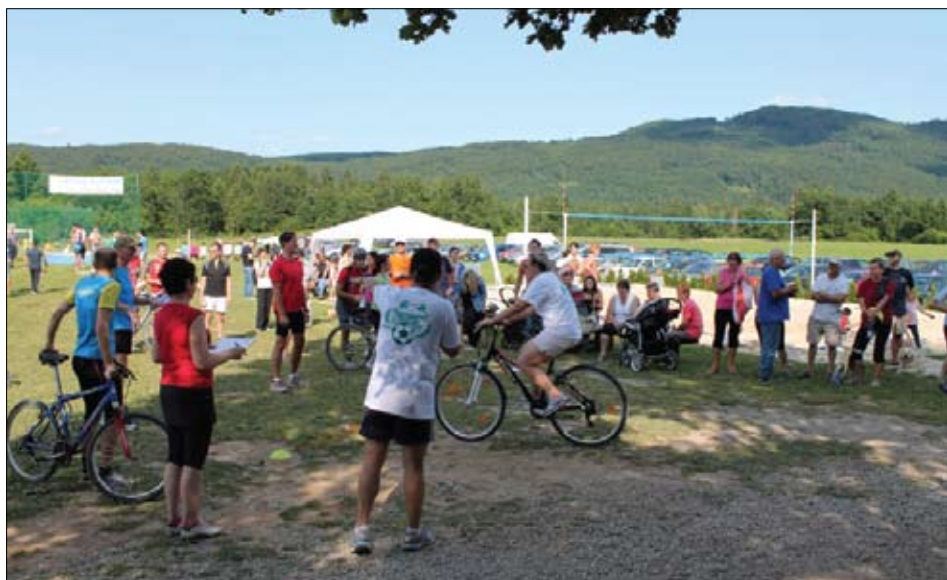
Razgibana množica na prireditvi

To lahko mirno zapišemo za prireditve 10. športni dan v Bruhanji vasi. Priprave so potekale praktično cel junij kot dobro namazan stroj. Le pri vremenu nismo vedeli, kako se bo zasakalo. Zadnji teden smo predvsem poslušali vremensko napoved in pogledovali v nebo. Eni so bili malo manj optimistični, drugi bolj, vsi pa smo bili izredno pozitivno naravnani in to se je pokazalo v nedeljo, 30. junija.