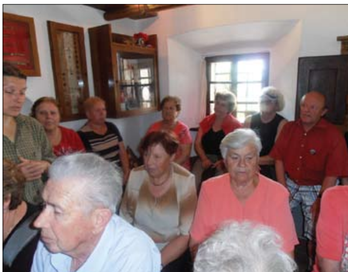
V Prešernovi hiši