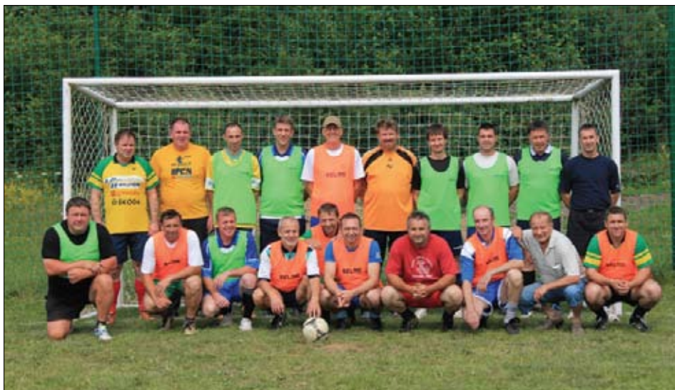
Dobro razpoloženi nogometni veterani Rače in Dobrepolja

la zaključena. Zadnje resno dejanje je bila podelitev zasluženih priznanj in pokalov. Letos je bila ta še za kanček slovesnejša, saj je bila to jubilejna, deseta, ponovitev prireditve. Lepo zagoreli od sonca smo si bili vsi udeleženci enotni – bilo je odlično, prireditve je ponudila za vsakogar nekaj. Bili smo sproščeni, bili smo športni in imeli smo se lepo. Po podelitvah je zaigral še lokalni bend in prešerno druženje ob petju in plesu se je nadaljevalo v večer.