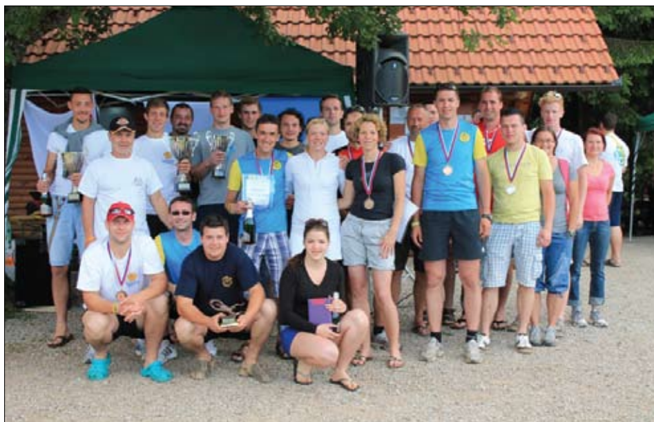
Dobitniki priznanj, medalj in pokalov