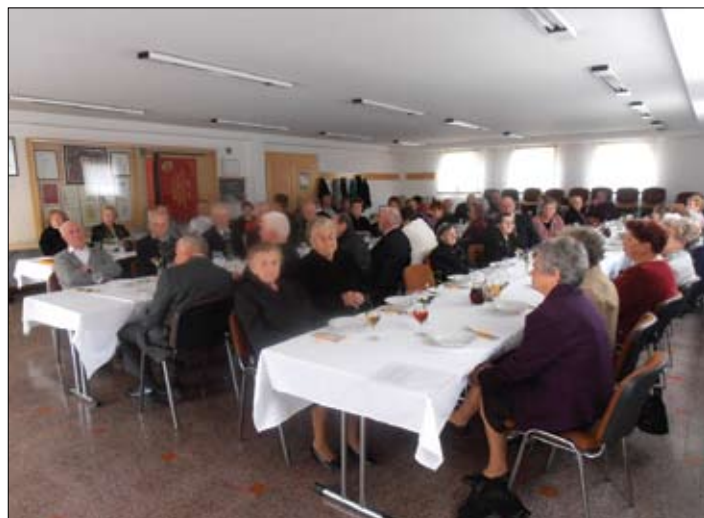
Zbrana družba 80-letnikov

Za soboto 15. junija smo svoje člane povabili na izlet na Gorenjsko. Najprej smo se ustavili na Brezjah in prisostvovali slovesni maši za bolne. Po končani maši smo se odpravili v Prešernovo rojstno hišo v Vrbi. V Begunjah smo obiskali rojstno hišo Slavka in Vilka Avsenika in si ogledali film o 60-letnem delovanju ansambla Avsenik. Po osvežitvi v njihovi restavraciji smo se odpravili na kosilo v lovski dom nad Žirovnico. Preživeli smo prijeten sobotni dan. ♦