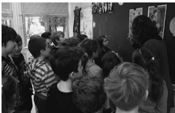
Slika 1: Oglad reprodukcije

Učenci so se pri pouku že izražali z jasno in sproščeno črto v različnih risarskih tehnikah in z različnimi risali, prav tako imajo že iz prejšnjih let pridobljeno osnovno znanje o preprostih grafičnih tehnikah (tisk s pečatniki, monotipija). Ob učiteljevi spodbudi so tako uvideli možnost uresničitve podobnega vizualnega učinka na svojem likovnem izrazu, kot je viden v prikazanih primerih japonskih lesorezov.