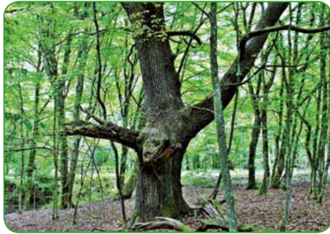
Eden od mogočnih hrastov v pragozdu

Vroče, sušno poletje, kot so vsa poletja zadnjih nekaj let; vmes prihrumijo divje nevihte, ki se jih najbolj bojimo, saj so samo še take, ki puščajo za sabo pravo razdejanje. Človek je s svojim pohlepom