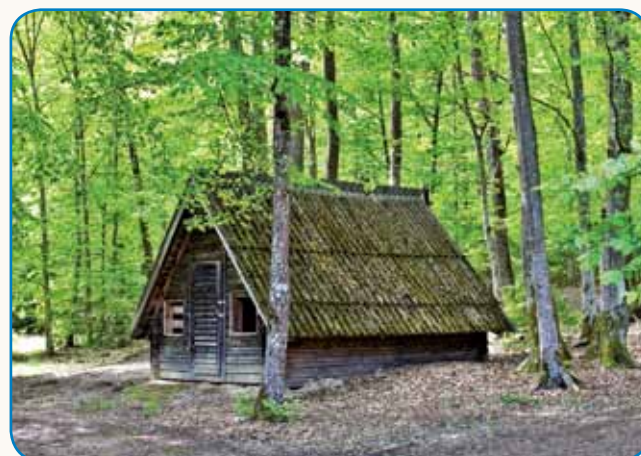
Zala - miška slovanska/slovenska reka stran 6-7