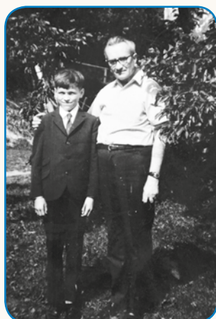
Prauti granici so nej vüпали... stran 4