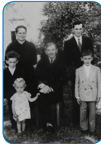
Mala Ana s starišami pa brati

mogo pelati, zato ka puno je brgav pa lagva, blatna paut je bila, več si ga tisko kak pa se pelo.«