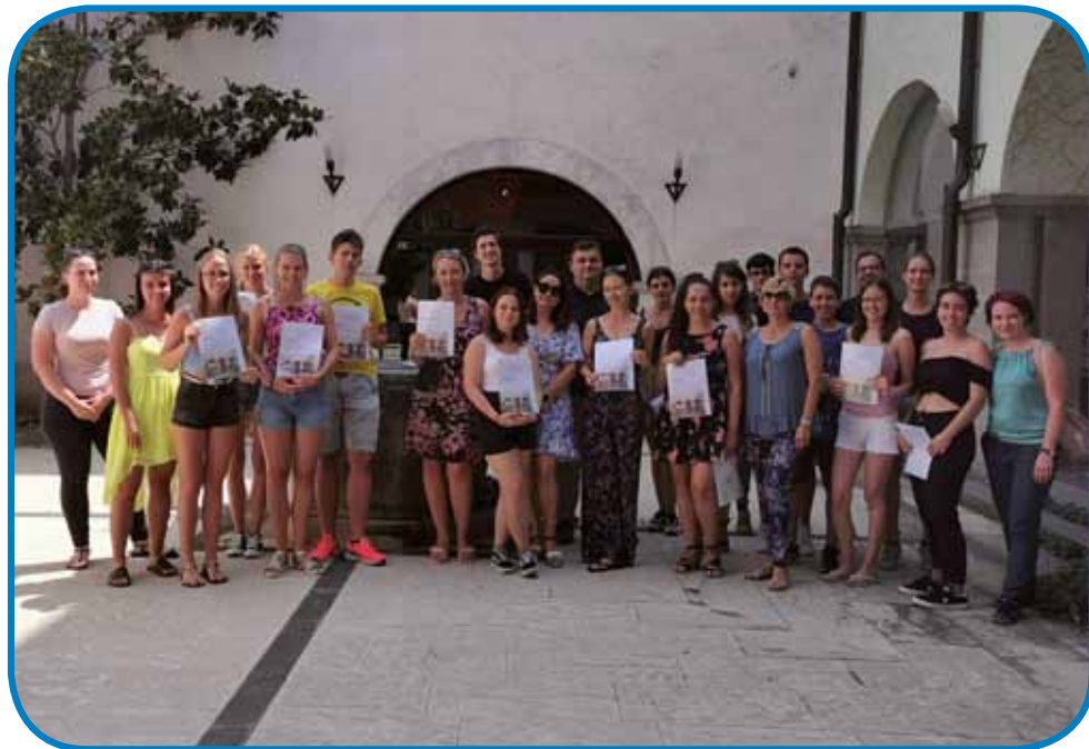
Skupinska slika po podelitvi certifikatov