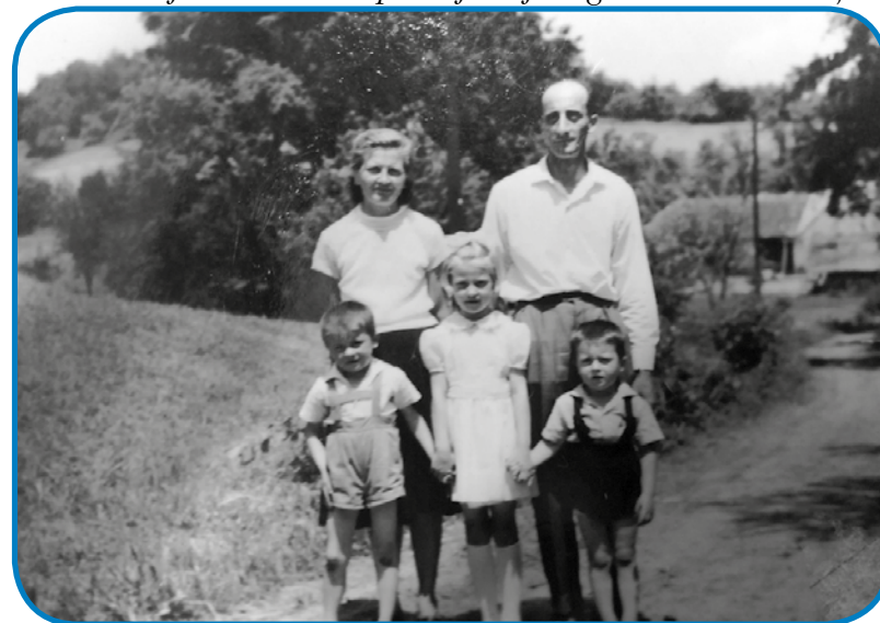
Gor je rasla na Gorenjom Seniki na Janezovom bregji

Kak se vam je pršikalo dobiti vsefale delo, material k zidanji?