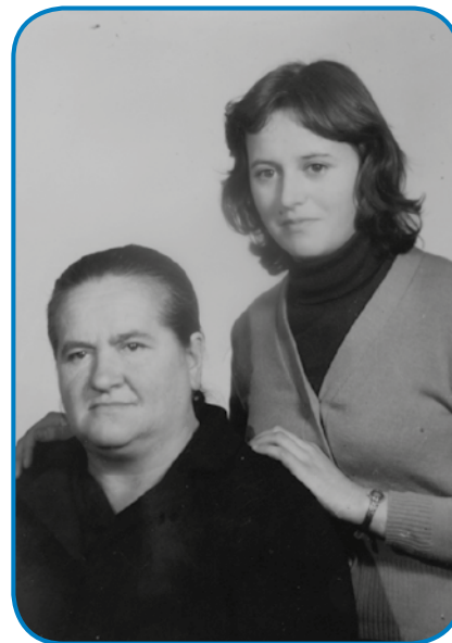
Mlada Ana z mamo

»Moj oča, gda je üšo k meši, on se je tak vönapelo, ka si ga mogo pogledniti, če si sto ali nej.