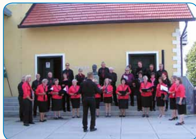
Vspomin generalu Rudolfu Maistru stran 5