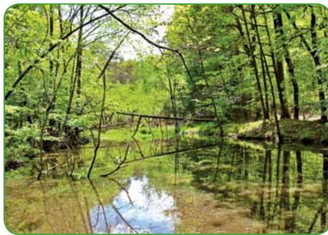
Jezerce brez imena tik pred izvirom

-madžarske meje. Najprej teče proti vzhodu čez Őrszentpéter in kmalu priteče v Zalsko županijo, kateri je dala ime. Tok proti vzhodu se nadaljuje čez Zalaľövő in Zalaegerszeg, kjer se najprej obrne proti severovzhodu, kmalu za tem pa