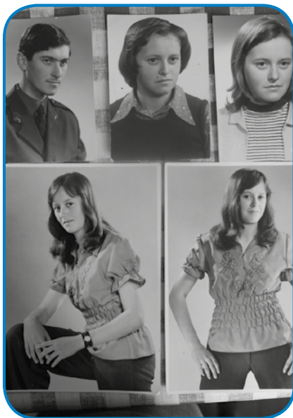
Kejpi, stere si je dala napraviti pri fotografiji Tanay

»Dja dosta ne paunim, tak pet lejt stara sem bila, gda je dejdek mrau. Edno dobro vejum, on je na Nemško odo delat, v slašičarni je poka-