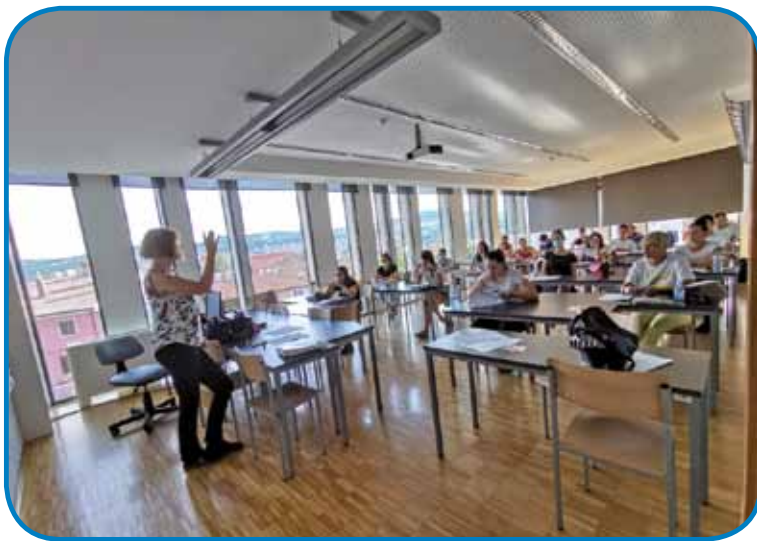
Udeleženci so bili na podlagi razvrstitvenega testa razdeljeni v skupine

sklanjatve slovenskega jezika. Mi smo uporabljali učbenik Centra za slovenščino kot drugi in tuji jezik. Cilj tečaja je bil, da dijaki osvojijo vse koristne izraze in osnove slovenske slovnice, poleg tega so lektorji dali velik poudarek tudi komunikaciji.