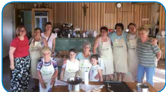
Vsi udeleženci delavnice

mejno sodelovanje Slovenija-Madžarska, 22. julija 2021 izved-