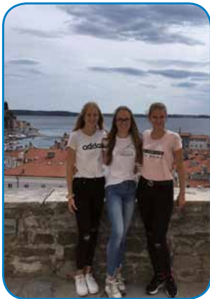
Med potepanjem po Piranu

V četrtek smo imeli zadnjo delavnico, to je bila kulinarčna delavnica, kjer smo lahko spoznali istrsko kuhinjo.