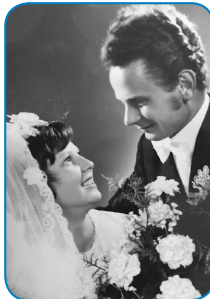
18 lejt je stara bila, gda se je oženila

ma svoje rame na Židovi, sin je pa eške tü doma z nama gé. Badva radiva delata, mata svojo slüž-