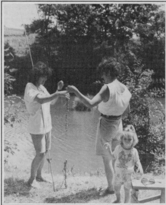
Časa je bilo na pretek, tudi za 'štrikanje' z najlonsko vrstico

RIBIČIADO '92 so omogočili sponzor KK Ptuj ter: Mlekarna Ptuj, TGA Kidričevo, Obrtna zbornica Ptuj, Opytl Ormož, Mesarija Fingušt, Vinarstvo Jeruzalem Ormož, Tovarna olja Slovenska Bistrica, pipovarna Union, Trim Metro Ptuj, Emona Merkur Ptuj, Mercator Izbira Panonija Ptuj, mesarija Matjašič, butik Sonja, papirnica Petlja, suha roba Pintar, Turističnoinformacijski center Ptuj, Pokrajinski muzej Ptuj, Ptujске pekarne in slaščičarne, Eurosport Ptuj, Agroavtometal, Medičarstvo in svečarstvo Puž, bife Mesarič ter Ribiška družina Ptuj in družina Knezovih.