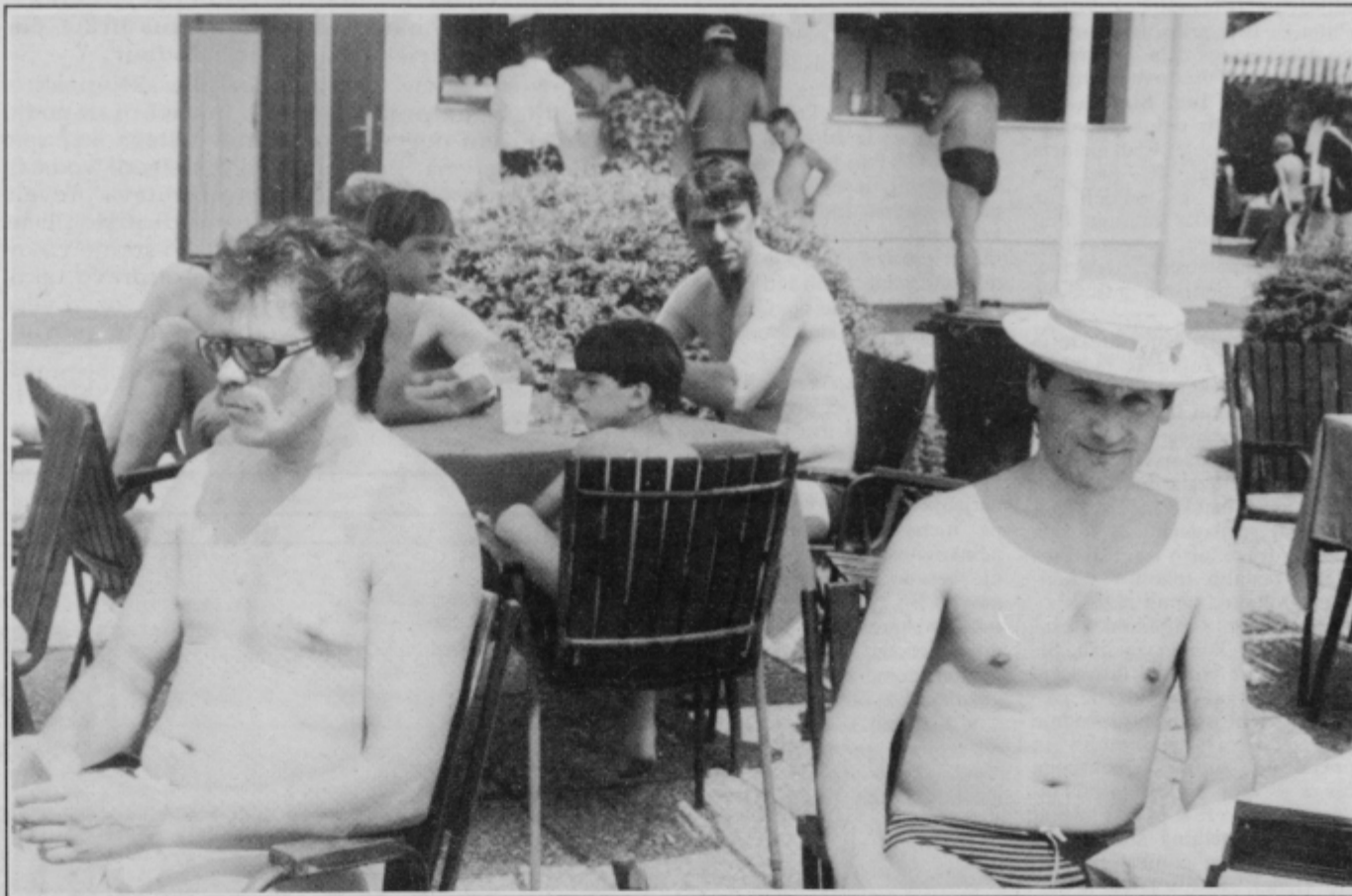
Pričeli so se dopusti... Kje bomo najbolj vroče dni preživel letos, kako je z našimi kopališči, preberite na strani 8.