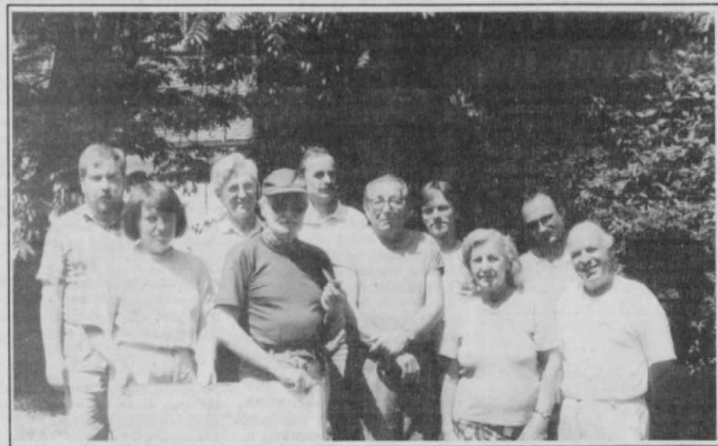
Udeleženci slikarske kolonije Borl '92

ni volji po ustvarjanju in ljubezni do narave.