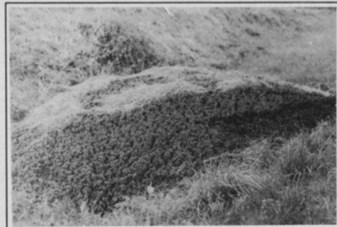
Mulj iz čistilne naprave je videti kot čisto pravi asfalt... (DL)

DESTRNIK: Da so ljudje pazljivi, kaj se dogaja v njihovem okolju, priča tudi tale prigoda. Prav takrat, ko so delavci Cestnega podjetja krpali cesto Janežovci-Jiršovci, si je eden od domačinov na svoj travnik ob cesti pripeljal prikolico mulja s ptujske komunalne čistilne naprave. Mulj je videti kot asfalt in ljudje, ogorčeni zaradi počasnosti in visoke cene storitev Cestnega podjetja Ptuj, so najprej mislili, da je ob cesti asfalt. Zgodba se je zdelala kar verjetna, saj so cestarje opazili v bližnjem vinotoču. Domačini so si mislili: No, vidiš, najprej so se napili, asfalt se jim je ohladil, na firmo ga niso upali peljati in so ga vsipali kar ob cesti in še s slamo so ga pokrili. Pa so se zbrali, poklicali novinarje in šele ob natančnem pregledu in pripovedovanju lastnika travnika ugotovili, da ne gre za asfalt. Njihova ogorčenost je splahnela, a je vsem v opomin: ljudje so občutljivi na dogajanje v svoji okolici in težko jih je pretentati. Bilo bi dobro, da bi to vedeli tudi načrtovalci občinskega odlagališča komunalnih odpadkov, ki naj bi bilo v opuščeni glinokopi v Jnežovcih.