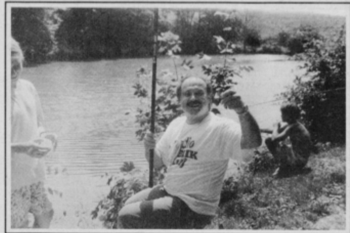
Pa ni bila najmanjša...

RIBIČIADO '92 so omogočili sponzor KK Ptuj ter: Mlekarna Ptuj, TGA Kidričevo, Obrtna zbornica Ptuj, Opytl Ormož, Mesarija Fingušt, Vinarstvo Jeruzalem Ormož, Tovarna olja Slovenska Bistrica, pipovarna Union, Trim Metro Ptuj, Emona Merkur Ptuj, Mercator Izbira Panonija Ptuj, mesarija Matjašič, butik Sonja, papirnica Petlja, suha roba Pintar, Turističnoinformacijski center Ptuj, Pokrajinski muzej Ptuj, Ptujске pekarne in slaščičarne, Eurosport Ptuj, Agroavtometal, Medičarstvo in svečarstvo Puž, bife Mesarič ter Ribiška družina Ptuj in družina Knezovih.