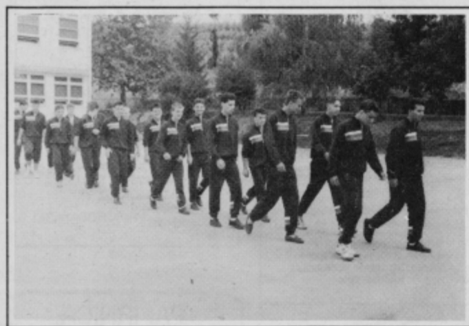
Prvi naborniki slovenske vojske so že v ptujski vojašnici