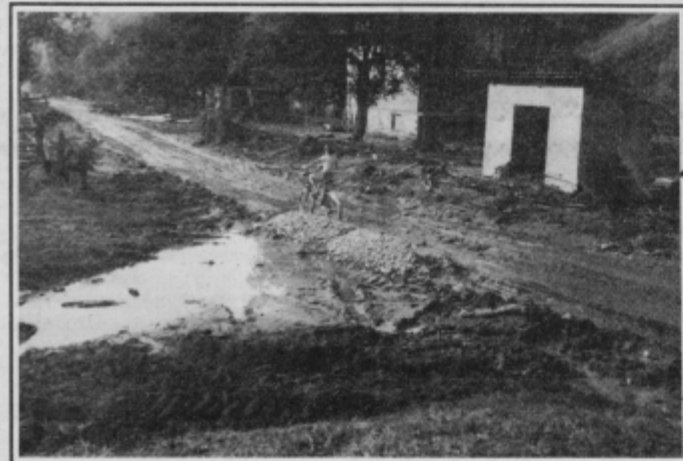
Spomin na divjanje narave v dolini Peklače. (OM)

DOLENA: Razdeljenost te krajevne skupnosti na haloški in drvaskopoljski del je usodna za razvoj haloškega dela. Na ravninskem delu imajo urejeno že skoraj vse, v dolini Peklače pa ne morejo zbrati dovolj denarja niti za javno telefonsko govornico, ki jo domačini nujno potrebujejo, da bi lahko poklicali zdravnika ali veterinarja. Na zadnjem referendumu samoprispevka niso izglasovali in tako sedaj večjih naložb v razvoj infrastrukture ni. Edino, kar v letošnjem letu pričakujejo, je ureditev vinske ceste Zgornja Pristava—Gorca—Dežno. Denar naj bi dobili iz republiškega sklada za razvoj demografsko ogroženih, delež krajanov pa bodo zbrali po posebnih pogodbah.