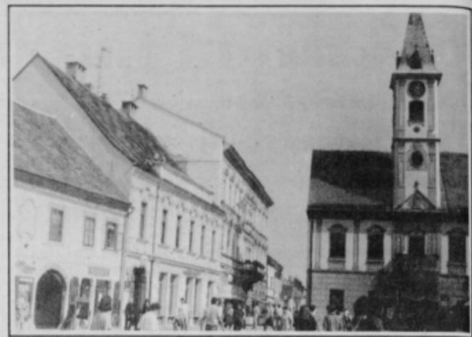
Varaždin v zgodnjem dopoldnevu še ni trgovska Meka

V eni od blagovnic nam je trgovka zaupala, da jih Slovenci rešujemo, saj pride na oddelku za tekstil na sto slovenskih en hrvaški kupec. Slovenci največ kupujejo obleko, preproge in belo tehniko.