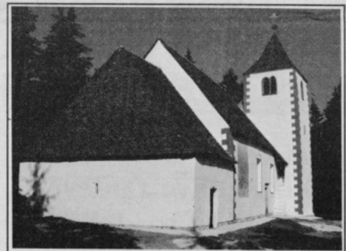
Obnovljena cerkev sv. Miklavža na Koritnem

Obnovitvena dela, ki so veljala skoraj 4 milijone tolarjev, je nadzoroval 11-članski odbor, v katerem so bili predstavniki oplotniške župnije, skupščine in izvršnega sveta, ZKO, škofijskega ordinariata iz Maribora, Narodne galerije iz Ljubljane, domače krajevne skupnosti in Zavoda za varstvo naravne in kulturne dediščine iz Maribora. Nadzor nad gradnjo je opravljal Mar-