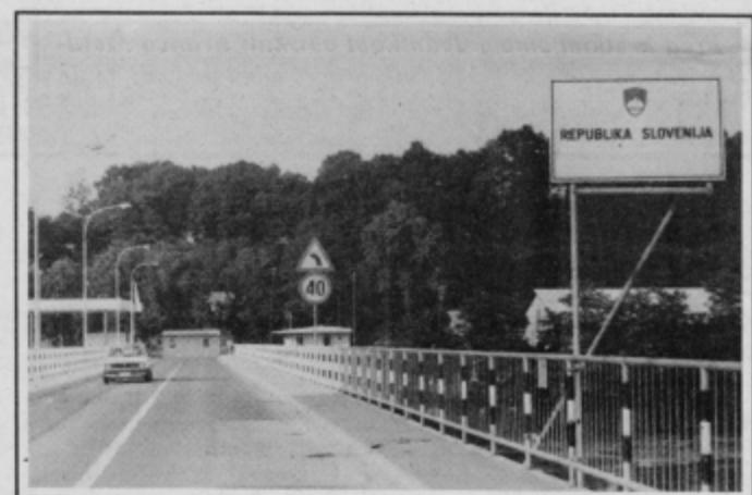
Dravski most in sporna tabla.