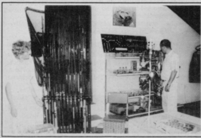
Vse za ribolov na enem mestu.

stvo za ribiče. Dober rezultat je v precejšnji meri odvisen tudi od kakovostne opreme. Dobro so se založili z opremo za mlade ribiče: juniorske sete ponujajo že od 1400 tolarjev naprej, ribiška kolesca pa od 700.