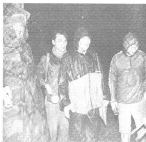
Premočeni taborniki so odkrili skrito kontrolo