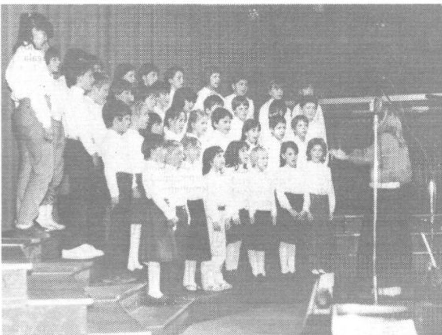
Nastop najmlajših: Za kvalitetno pesem je potrebno veliko dela