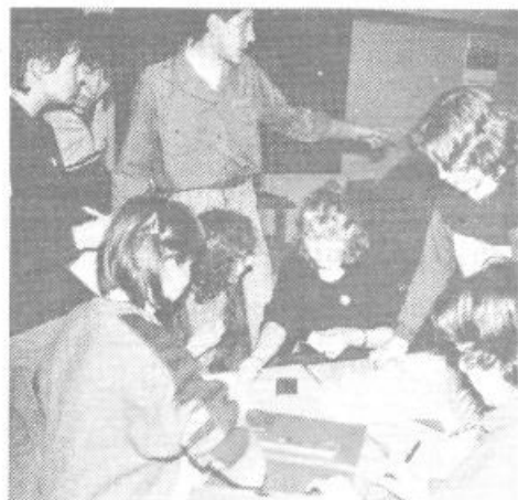
Tabornice vrisujejo kontrole točke v zemljevid