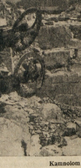
Kamnoolom pri Devetakih