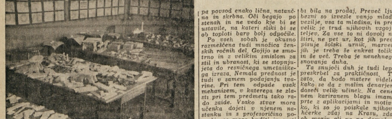
Razstava Nižega strokovnega tečaja (deski oddelek) v Rojanu

Na razstavo industrijske strokovne šole v Rojanu je odpravljamo z zavestjo, da bomo spet doživeli nekaj lepega, nekaj takega, kar nam bo za dolgo ostalo v prijetnem spominu in dramilo naš ponos. In res, nismo se varali. Se več! Čakalo nas je to in ono prijetno presenečenje, ki ga v dolgi vrsti stališč in skupno z dijaki pripravljali nenehno s snujocih dak fantazije njihovih vzgojiteljev. Ta duh bi di k življenju nove izdelke, ki tvorijo iz leta in leti stvarni in vidni napredek tega nam bržskoli Slovencem tako draga učnega zavoda.