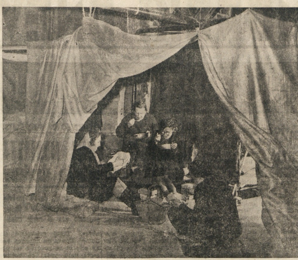
Begunci iz Vzhodne Nemčije preplavljajo begunska taborišča zahodnega Berlina. — Begunsko kosilo v zaslonu prilagojenih ruševinah bombardiranega poslopja.