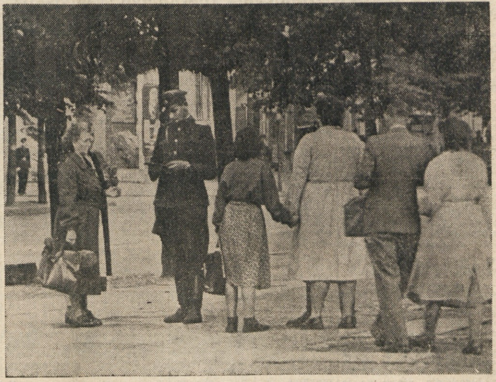
Prebivalci vzhodnega Berlina se po več dneh prisilnega bivanja v zahodnem Berlinu, ker so sovjetske oblasti zaprle vse prehode, vračajo na svoje domove. Prav tako se prebivalci zahodnega Berlina, ki so ostali več dni v vzhodnem Berlinu, sedaj vračajo. Na sliki je zastnik vzhodnonemške policije, ki pregleduje osebne dokumente