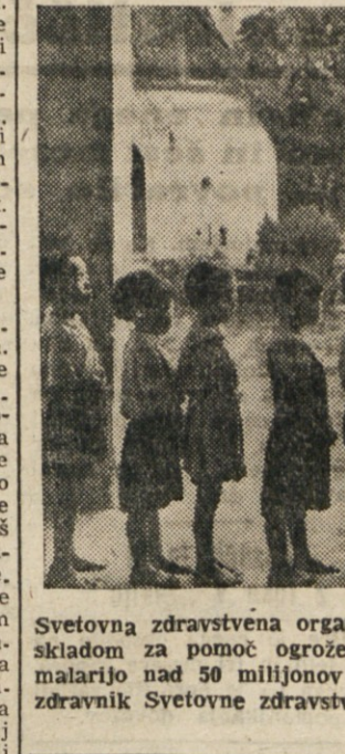
Svetovna zdravstvena organizacija je skupaj z Mednarodnim skladom za pomoč ogroženim otrokom doslej ščitila pred malarijo nad 50 milijonov ljudi. Slika kaže, kako pregleduje zdravnik Svetovne zdravstvene organizacije otroke v Tajski