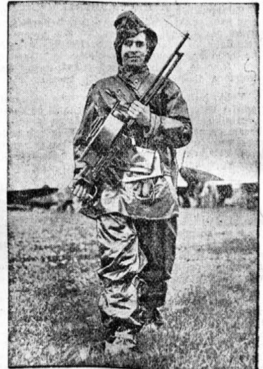
V angleških vojaških letališčih ima osebje posebne vrste obleko, skozi katero ne morejo strupeni plini, kakršne bodo uporabljali v bodoči »kemistični vojni«.