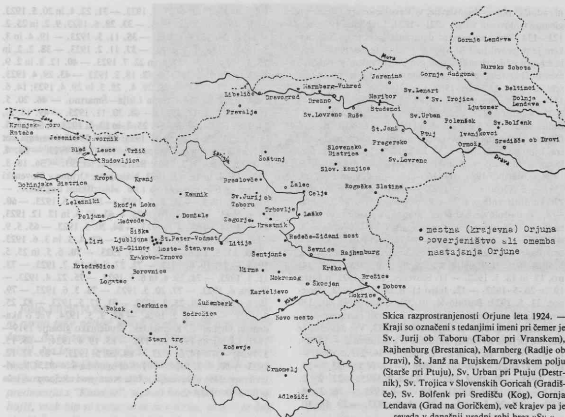
• mestna (krajevna) Orjuna ○ poverjenišтво ali omemba nastajanja Orjune Skica razprostranjenosti Orjune leta 1924. — Kraji so označeni s tedanjimi imeni pri čemer je Sv. Jurij ob Taboru (Tabor pri Vranskem), Rajhenburg (Brestanica), Marnberg (Radlje ob Dravi), Št. Janž na Ptujskem/Dravskem polju (Starše pri Ptuj), Sv. Urban pri Ptuj (Destrnik), Sv. Trojica v Slovenskih Goricah (Gradišče), Sv. Bolfenk pri Središču (Kog), Gornja Lendava (Grad na Goričkem), več krajev pa je seveda v današnji uradni rabi brez »Sv.«

mesto, Radovljica), nato pa — kakor kaže — do srede aprila 1923 pravil Orjune niso potrjevali. Nedvomno gre za reakcijo na teroristično dejavnost Orjune na Štajerskem proti Slovenski ljudski stranki in nemški manjšini februarja 1923 v Celju in Mariboru in aprila v Slovenski Bistrici. Kaže pa, da je bila centralna oblast Orjuni bolj naklonjena in od srede aprila 1923 so nato potrdili pravila kar enajstim Orjunam: Litija, Bled, Bohinjska Bistrica, Cerknica, Kranj, Domžale, Mokronog, Poljane in Stari trg, nato pa še Tržič in Logatec. Maja so potrdili pravila še devetim Orjunam: v Žužemberku, Lescah, Zagorju, Borovnici, Škofji Loki, Hrastniku, Žireh, Dobovi in Trbovljah ter v juliju še trem (Ljubljana, Javornik, Karteljevo). Avgusta sta dobili potrjeni pravili Orjuni Št. Peter—Vodmat in Rajhenburg, septembra še Spodnja Šiška in Železniki, novembra pa Moste—Štepanja vas, Laško in Radeče. 91