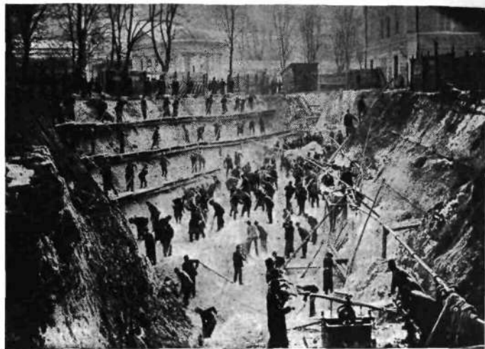
Dela pri zajemanju vrelecev v Rogaški Slatini l. 1908.

Zgodovina nam poroča o mnogih Grkih, ki so prišli v Rim, prinesli s seboj grško znanstvo in tu kot zdravniki našli svojo srečo. V petem stoletju se omenjajo že prve terme. Akoravno so bile prve tople kopeli v temnih in preprostih prostorih, so se sčasoma kopališča opremila z največjim razkošjem in če čitamo poročila o cesarskih termah, moramo priznati, da luksus nekaterih današnjih mondenskih kopališč še daleč zaostaja za onim v rimskih termah cesarske dobe. S slonovo kostjo, zlatom in srebrom so bile okrašene marmornate kadi, s prodajalnami, bibliotekami in galerijami umetnin so bila obdana javna kopališča, kopalni vodi so se dodajale razne dišave in cesar Caligula se je kopal celo v dišavnih oljih. Z ureditvijo nešteti javnih kopališč so si oblasti prizadevale, nuditi tudi revnejšim slojem udobnosti kopanja; pri bogatinih so bila ta kopališča opremljena z največjim razkošjem. Rimljan pa ni bil le zadovoljen z rafinirano opremljenim svojim kopališčem, mikala so ga tudi že potovanja v tuja kopališča. Čarobne Baje, ki jih je leta 1538. požar popolnoma uničil, so bile glavna privlačna sila za petične Rimljane, Marius, Piso, Pompej, Julij Cezar, Antonij in drugi so imeli tu svoja letna bivališča, ki so bila središča razkošja in dostikrat tudi pozornica važnih dogodkov.