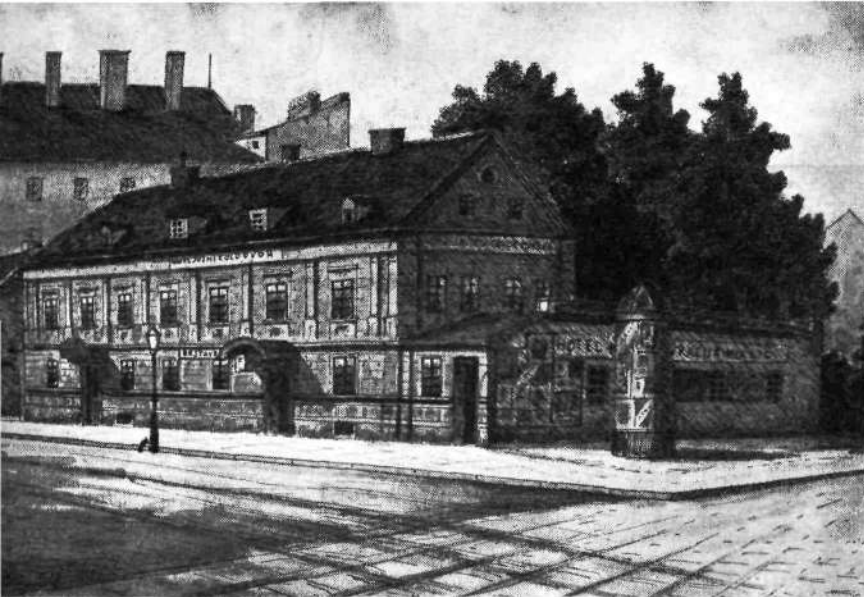
Stara stavba hotela „Južni kolodvor“ v Ljubljani