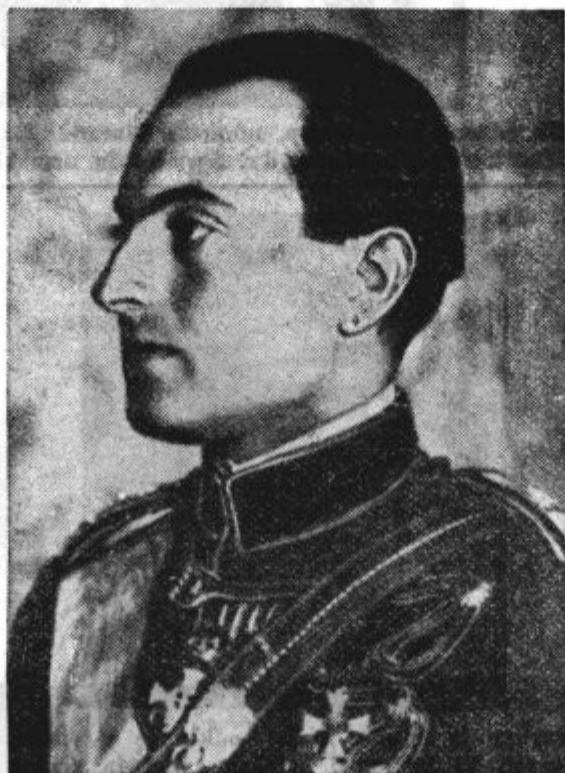
Nj. Vis. knez namestnik Pavle, od katerega ves narod pričakuje blagodejnega vpliva na razvoj naše zgodovine v smislu narodnega sporazuma.

Temu početju je uprava laške pivovarne napravila konec, ko je s spremenjenimi pravili onemogočila vsako tako špekulacijo. Na nedavnem občnem zboru laške pivovarne je bil ugotovljen nepričakovan uspeh in napredek podjetja.