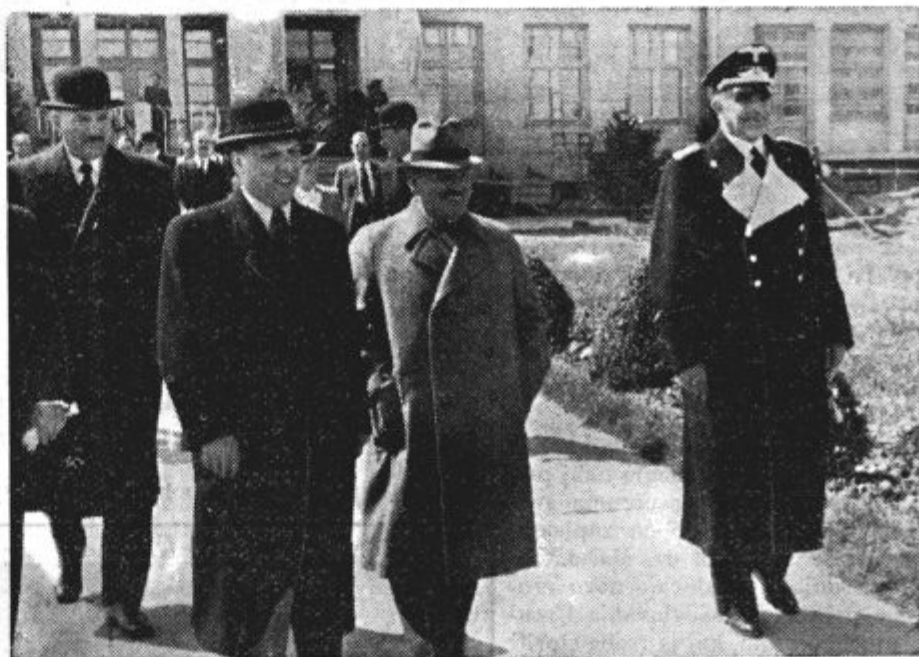
Ob odhodu našega zun. ministra Cincar-Markovića v Berlinu. Z leve na desno: dr. Cincar-Marković, minister dr. Spaho in nemški poslanik v. Heeren, ko odhajajo k letalu.

Kmetje, obrtniki in podeželski delavci! Zahtevajte v vsakem gostilniškem lokalu, kamor zahajate in dajte zaslužka. „Kmetški list“!