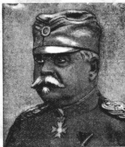
Pravkar je minilo 10 let, odkar je v visoki starosti 73 let umrl splošno znani in slavni vojskovodja, vojvoda Stepa Stepanović,