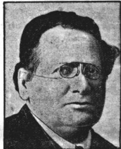
Ruski zunanji minister Litvinov igra v sedanjem političnem položaju važno vlogo, ki utegne čez čas postati še pomembnejša.