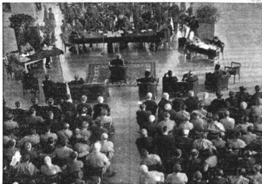
Prizor s skupščine Sokola kraljevine Jugoslavije v Beogradu