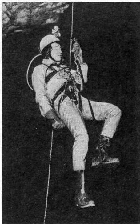
Morda je bistvena razlika med »podzemeljskim« in »površinskim« alpinizmom ta, da je za prvo vrv »osnovno« sredstvo, za druge pa le varovalni pripomoček

zerskem. Vmes navaja tudi take, iz katerih prihrumi nevihta ali se privali ven megla, če vržeš kamen vanjo (luknja na Jezer-skem). Iz nekaterih zapisa hud veter — Veternek nad Čemšenikom. Take so posebno pogoste v gorah. Omenja tudi naravne predore in »luknje skozi gore«. Marsikatero med temi luknjami danes ne moremo identificirati. Morda je bila res taka jama ali luknja, pa je danes ne poznamo oziroma je ni več, ali pa je zapisal ljudsko izmišljotino ali govorico. Včasih je vsakega malo, malo resnice in malo pretiravanja, kot je npr. »okno, skozi katerega greš iz Kranjske gore v Bovec«.